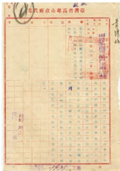
圖 1. 高雄市政府發給臺灣警備司令部的公文