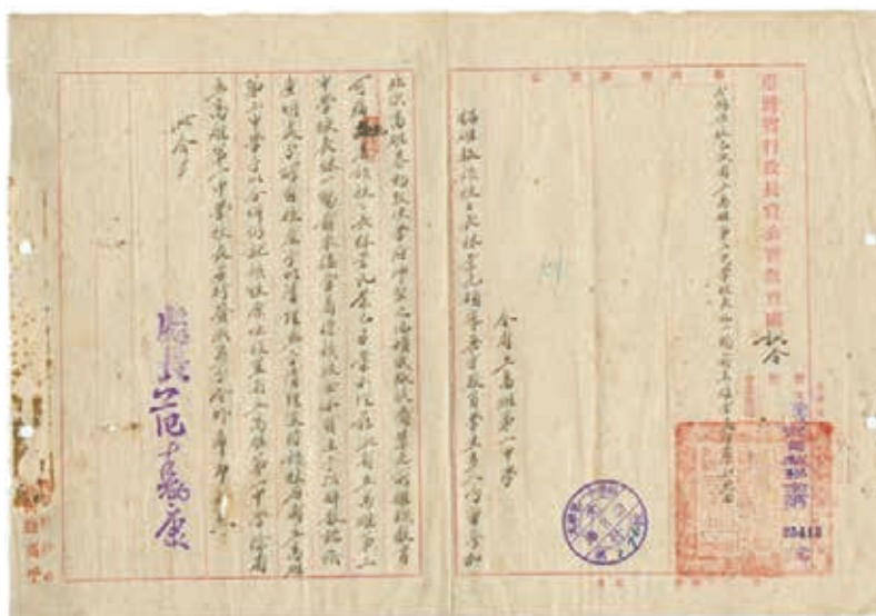
圖 2. 臺灣省行政長官公署教育廳發給高雄第一中學的訓令 資料來源：檔案管理局時光檔案盒 ( http://theme.archives.gov.tw/theme5_1.html ) (2014)