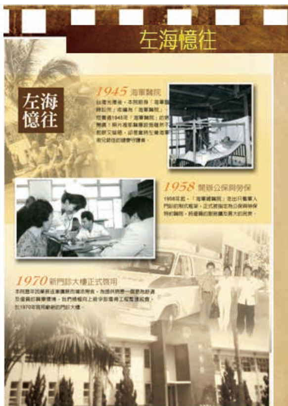
圖 5. 院慶六十周年時設計的宣傳海報 資料來源：國軍左營總醫院網頁 ( http://806.mnd.gov.tw/gf/project/ ) (2014)

貴的史料檔案，像在院慶 60 周年時掛出的宣傳海報（如圖 5），或記錄當時潛水醫學大樓竣工驗收的大事紀要月報表（如圖 6）。