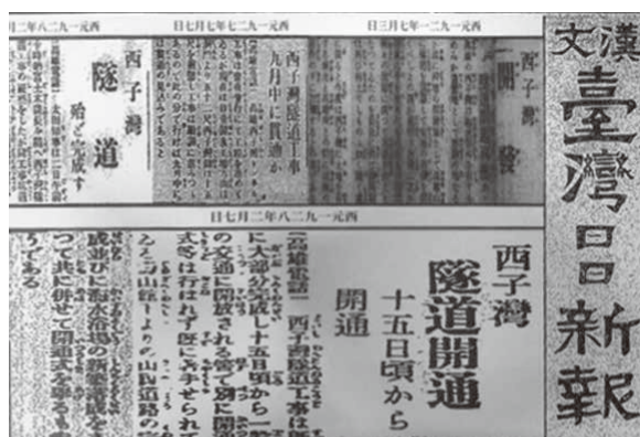
圖 7. 日本統治時期報紙刊載西子灣隧道開通