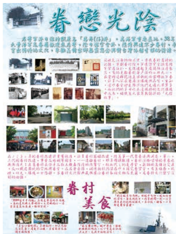
圖 3. 左營海軍眷村文化的紀錄圖