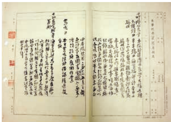
圖 6. 潛水醫學大樓竣工驗收的大事紀要月報表