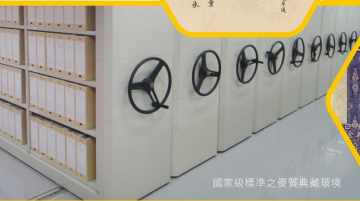
國家級標準之優質典藏環境