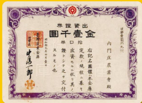
臺灣產業金庫出資證券 (高雄市內門區農會捐贈)

每段歷史都是前人走過的足跡，每紙珍貴文書都是刻劃國家歷史發展與記憶的光光片羽，回首過去，我們一起經歷的點點滴滴，每一個過往都值得回憶，也需要共同守護；您是否擁有這樣的珍貴文件或資料？只要經過鑑定確認為具有永久保存價值，可以呈現民間文化發展與歷史脈絡，或與政府機關之檔案具互補性者，都是我們亟欲探尋及典藏的珍貴文書！