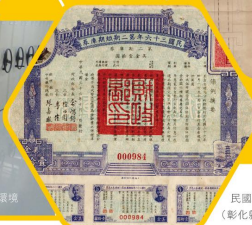
民國36年第2期短期庫券 (彰化縣農會捐贈)