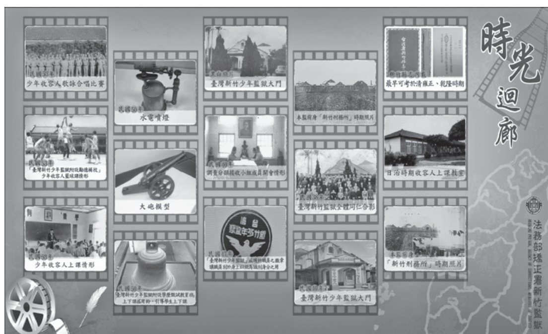
圖8 時光隧道迴廊展覽海報