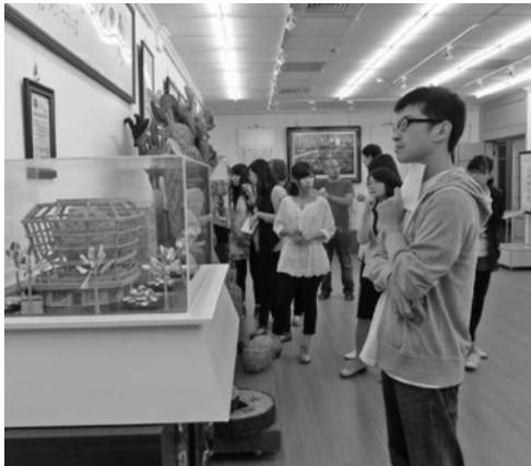
圖 9 專設收容人教化訓練成果展覽室