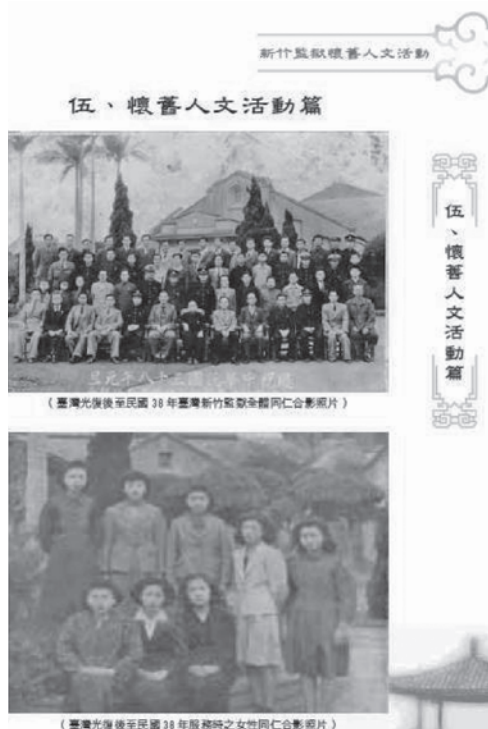
圖 12 新竹監獄監志紀要

資料來源：檔案樂活情報，〈回首建國百年的「檔案好戲」〉（民國 101 年 9 月 17 日）。〈 http://alohas.archives.gov.tw/63/idea.html 〉（2 Jan.104）。