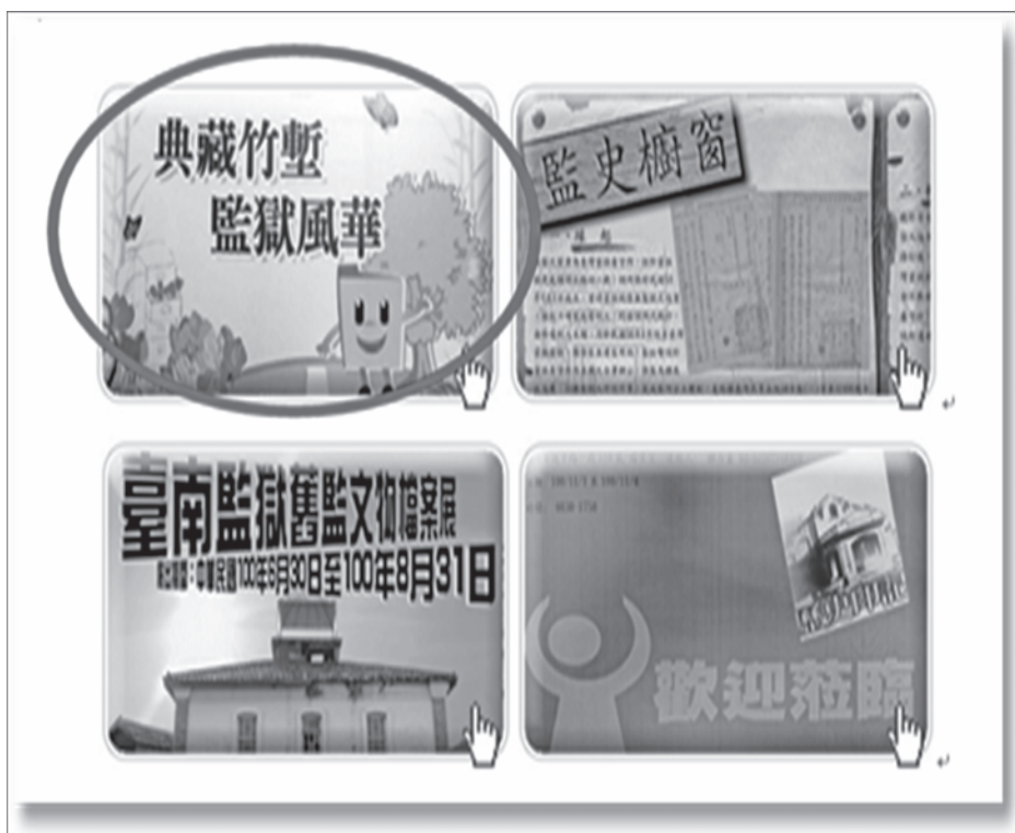
圖 11 刊登於檔案管理局檔案樂活情報