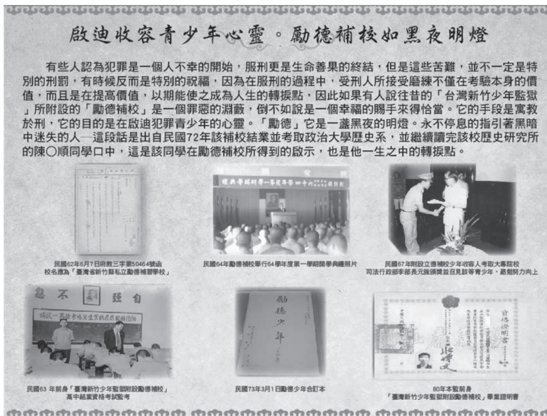
圖7 機關大事紀展覽海報