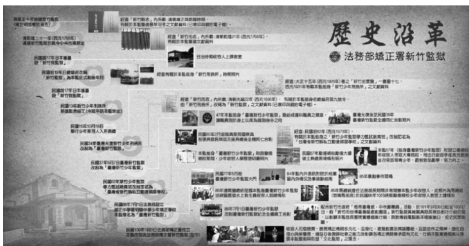
圖6 機關沿革展覽海報