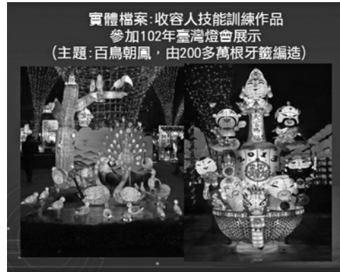
圖 10 「新竹市世博臺灣館產創園區」花燈競賽展覽照片

透過網路資訊無遠弗屆力量，行銷獄政檔案的故事，希冀發揮獄政檔案多元化價值，改變民眾對監所之刻板印象，讓這塊富庶的檔案園地，碩果纍