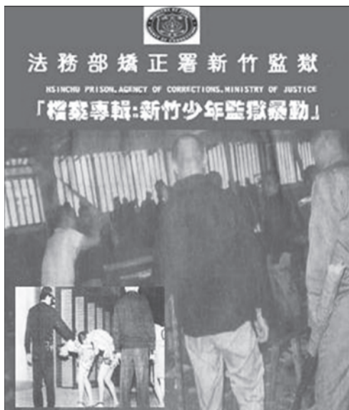
圖2 新竹少年監獄騷（暴）動檔案專輯