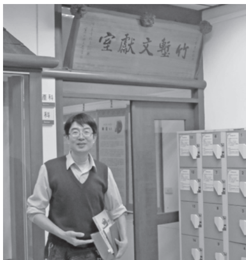
圖3 作者溯源蒐集機關前身資料

資料來源：新竹少年監獄暴動華視新聞報導案，〈法務部矯正署新竹監獄〉（民國103年7月22日），檔號0103/071099/0016/1/30。