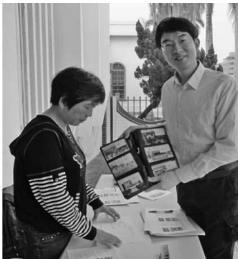
圖1 參與「獄政文物展覽館」大型聯合展覽

機關內具有單一、獨特事件所留下照片、文字、數據…等，往往可提供他單位參考借鏡使用，例如新竹監獄前身出版之「新竹少年監獄騷（暴）動」檔案專輯（下頁圖2），分別為71年2月7日、71年3月29日與85年11月19日計3篇，並結集成專冊，供法務部矯正署訓練學矯正人員（三等監獄官、四等監獄管理員）訓練課程，為檔案活化應用之強力佐證 (註4) 。