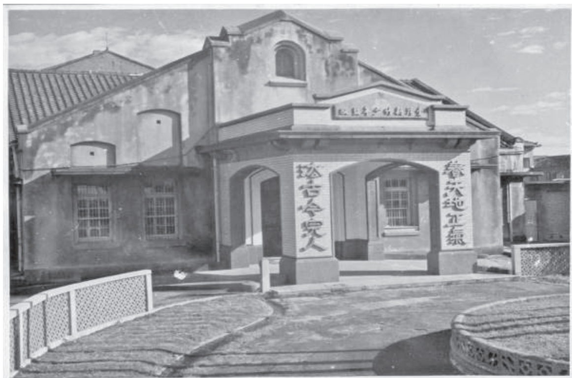
（新竹監獄・心築監獄）