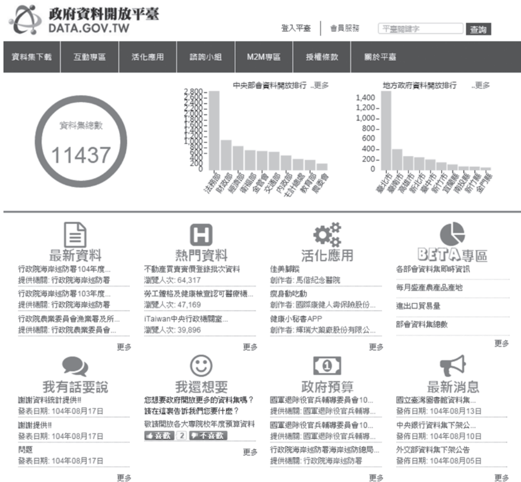
圖 2 政府資料開放平臺