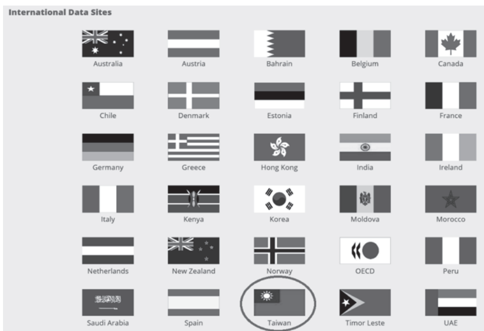
圖 5 新加坡 Data.gov.sg 國際資料網站

資料來源："Open Data Internationally", Data.gov Website , ( https://www.data.gov/open-gov/ ) (17 Aug. 2015).