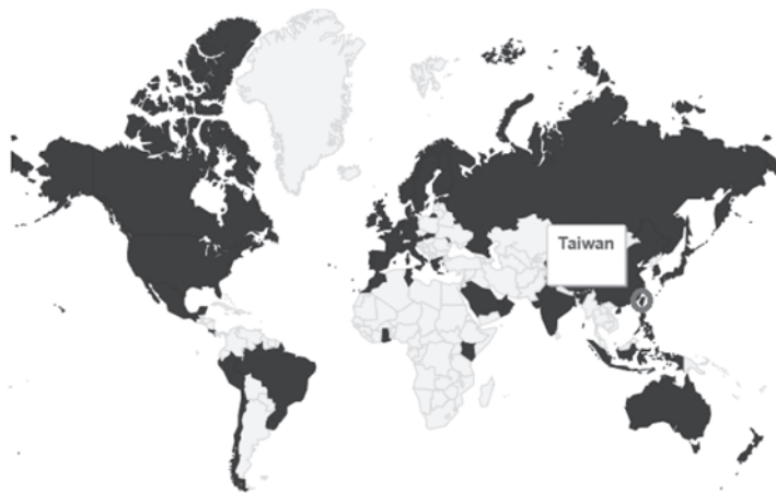
圖 4 美國 Data.gov 國際資料開放地圖

Nations around the world have followed the example of Data.gov in opening up a wide variety of data for citizens and businesses. Download the full list of open data sites in the following formats: [CSV] | [EXCEL]