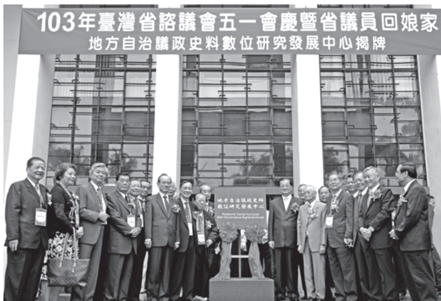
圖2 地方自治議政史料數位研究發展中心揭牌成立