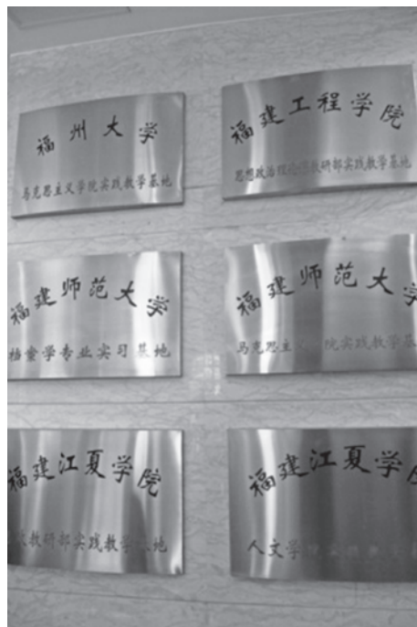
圖7 福建省檔案館與各大學共建實踐基地牌

福建省檔案館平時即與附近大學簽訂實習合作計畫（圖7），提供學生揉合理論與實務的場域，故本次國際檔案日商請中國大陸之福建師範大學、福州大學、福建工程學院、福建江夏學院選派學生共同參與相關活動如聆聽現場精彩的演講，以增進對檔案的利用教育之認識。此外，參與本次活動之中國大陸福建省在地各校學生與我國國立政治大學圖書檔案資訊所學生等，亦透過此機會，進行不同主題的互動交流，交換彼此學習心得（圖8）。