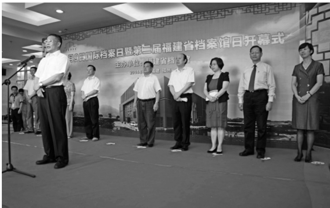
圖 1 開幕式現場

本次國際檔案日係以「走進檔案」為主題，企圖引領民眾接近、瞭解並使用檔案，而福建省檔案館於檔案日開幕式即以「尋找你心中的記憶」為主軸（圖 1），串聯起相關的系列活動，包括「僑批文化研究中心揭牌」、「檔案捐贈儀式」、「共建實踐教學基地授牌」、「查閱檔案活動」、「參觀體驗檔案修裱與複製」、「兩岸檔案工作互動」、「家庭檔案講座與展