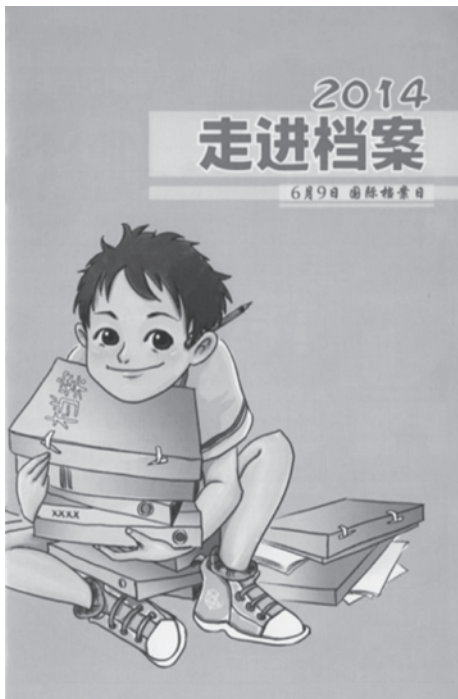
圖 2 《2014 走進檔案—6 月 9 日國際檔案日》書影