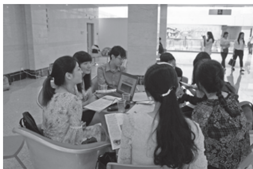
圖8 兩岸學子交流情況