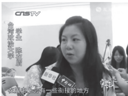
圖6 國立政治大學圖書資訊與檔案學研究所學生受訪畫面

福建省檔案館與相關媒體維持良好關係，而此次國際檔案日亦有中國的通訊社前來報導（圖6）。另外，在地方檔案館方面，如晉江市檔案館便與晉江經濟報密切合作，由檔案館提供報導題材予報社，增加新聞內容，報社亦提供平台媒介予檔案館宣傳政令，都是可供參酌的方法。