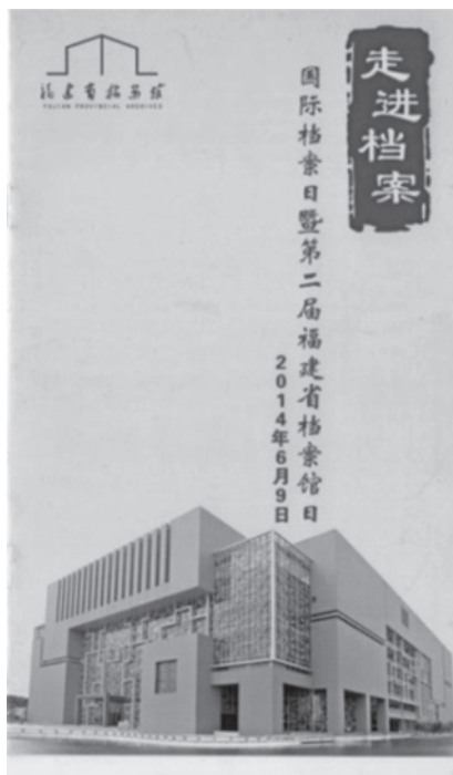
圖 3 《走進檔案—國際檔案日暨第二屆福建省檔案館日》書影