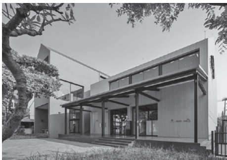
圖 6 TCDC 清邁分部外觀

資料來源：TCDC Website, 〈 http://www.tcdc.or.th/chiangmai/ 〉(20 Jan. 2015)。