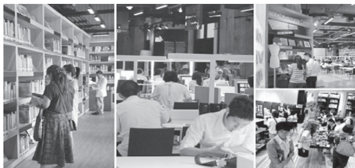
圖 2 資源中心（一）

Material ConneXion Bangkok，是亞洲第一個創新設計的材料庫。該材料庫蒐集各種有趣的材料、實際的樣品及最新的創意訊息，讓使用者在設計素材的世界裏，有機會探索國際頂尖設計材料的最新發展，激發設計者的靈感，讓創意與素材結合成為實際的物件。（上開