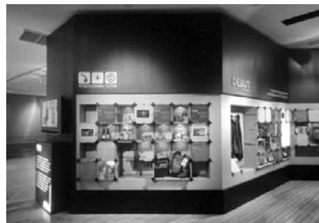
圖 1 TCDC 展示空間一隅