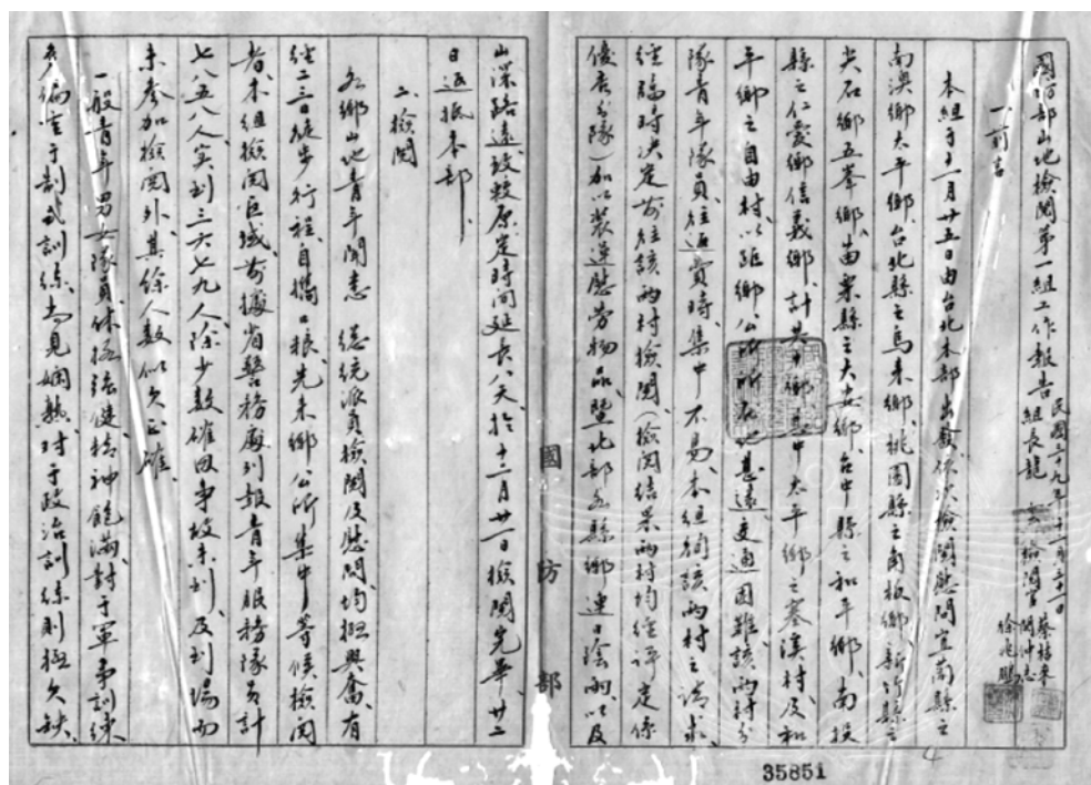
圖2 報告書內文首頁