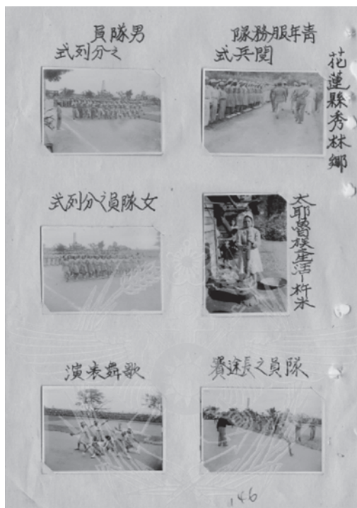
圖 4 照片輯內頁之一