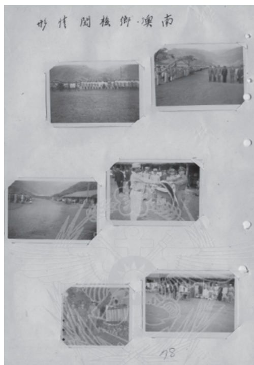
圖 5 照片輯內頁之二

資料來源：國防部山地檢閱及慰問工作報告書，〈國防部檔案〉，（1950.12.31），國防部，檔號：520550001。