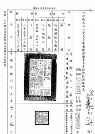
圖 3：印信啟用報備表：行政院九二一震災災後重建推動委員會，〈印信製發啟用〉：0089/07/07-05

印信，鏤刻著機關歲月的痕跡，本局典藏的這批印信鑄造年代最早的是行政院主計處特級印(38 年 4 月鑄造)，年代最晚的是桃園縣政府及桃園縣議會之特級印(皆為 100 年 7 月製發)，期間跨越臺灣光復後 60 多年的歷史，見證了縣市升格、行政院組織改造、九二一震災與莫拉克風災重建等重大事件，縱然隨著時光的遞嬗、政策的調整，許多機關或有改制變動，但藉由這批廢舊印信，仍能緬懷過去業務的運行歷程，驗證文物之美歷史之真。