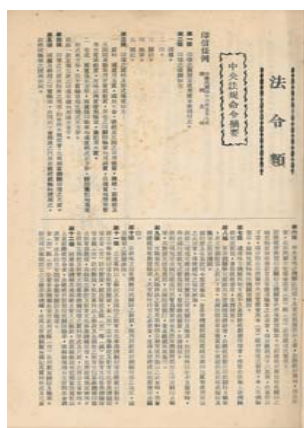
圖2：民國46年修正公布之印信條例：臺灣機械股份有限公司，〈印信條例〉：0048/017/65

其實，印信的種類不只上述的「國璽」及「印」，根據民國(以下同)18年國民政府制定公布的「印信條例」，印信分印、關防、鈐記、小章4種，32年修正為印、關防、鈐記、官章4種，46年修訂為國璽、印、關防、職章及圖記5種並沿用至今。 3 各類印信之質料、形式與使用規定不盡相同，國璽有二方，材質皆為玉質，形式為正方形、國徽鈕，於17年10月由中國國民黨中央執行委員會決定製造，「中華民國之璽」選用翠玉刻鑄而成，為代表國家之印信，蓋用於總統所頒發的各項外交文書；「榮典之璽」則用羊脂玉打造，蓋用於總統所頒發的各項褒獎書狀。 4 印多用銅質，惟總統及五院院長之印採用銀質，形式為直柄式正方形，蓋用於永久性機關之公文；關防均用銅質，呈直柄式長方形，蓋用於臨時性或特殊性機關之公文；職章多用銅質、直柄式正方形，但牙質職章為立體式正方形，蓋用於呈文、簽呈各種證券、報表及其他公務文件；圖記用木質、直柄式長方形，蓋用於公務業務或各項證明文件上。 5