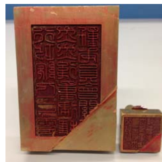
圖 4：行政院九二一震災災後重建推動委員會廢舊印信：0089/07/07-15