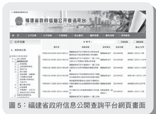
圖5：福建省政府信息公開查詢平台網頁畫面

晉江市檔案館新館位於晉江市新行政中心核心區，現為國家二級檔案館（註8），同時也是晉江的檔案查閱利用服務中心、政府信息公開查閱中心與電子文件管理中心（註9）。