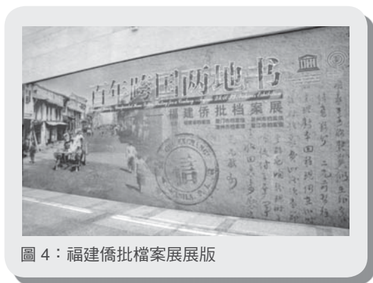
圖 4：福建僑批檔案展展版

除了上述的 4 大部分檔案之外，福建省檔案館也相當重視僑批檔案及家庭檔案的徵集與整理。僑批是華僑寄回國內的家書、簡單附言及匯款的憑證，自 2013 年 6 月僑批檔案入選世界記憶遺產名錄以後，該館便積極推廣相關成果，如在海內、外舉辦僑批檔案巡迴展覽。2014 年 6 月 9 日，僑批文化研究中心更正式在福建省檔案館揭牌成立，同時在館內舉行「百年跨國兩地書——福建僑批檔案展」，如圖 4（註 4）。