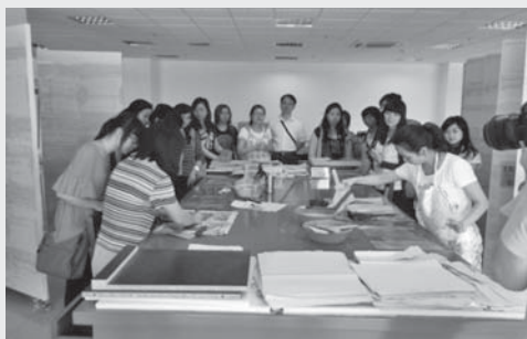
圖 3：修裱室內進行修復作業