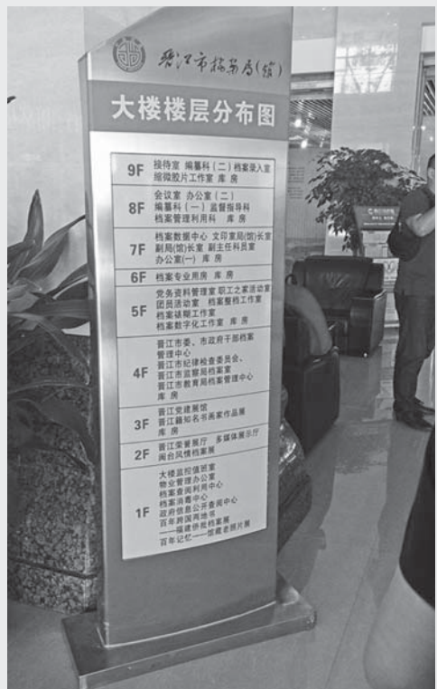
圖 8：晉江市檔案館樓層分布圖

晉江市檔案局與檔案館合署辦公，屬兩塊招牌、一套人馬之制度。編制 14 人，包含局長 1 名、副局長 1 名。其組織機構編制設有秘書科、監督指導科、管理利用科和編纂科等科室。