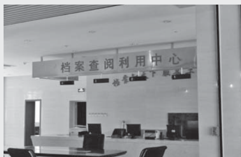
圖 9：晉江市檔案館檔案查閱利用中心

一般民眾可透過到館閱覽、短期借閱、申請檔案複製與網路查詢的方式來查檢利用檔案，館內在 1 樓大廳設置了檔案利用查閱中心與政府信息公開查閱中心（見圖 9），民眾只要攜帶個人有效身分證件與相關資料，便能在