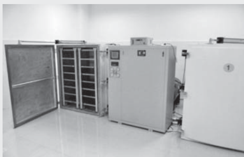
圖 2：真空充氮消毒室內部

此外，檔案庫房總面積將近 14,000 平方公尺，安全保管方面配有溫溼度自動監控系統、檔案安全監控系統、檔案消防警報和高壓細水霧自動滅火系統等 3 個系統，以及恆溫恆溼設備、冷凍消毒室、真空充氮消毒室（見圖 2）可確保檔案之安全，並有檔案修裱工作室搭配進行檔案修護工作（見圖 3）；檔案仿真