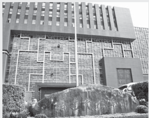
圖1：福建省檔案館外觀

新館開工於2008年11月，歷時4年建設，占地40多畝，建築面積4萬多平方公尺，於2012年12月啓用。主要職責是蒐集、保管省政府及其所屬部門的檔案，集檔案安全保管基地、檔案資料和政府信息查閱中心、電子文件與數位檔案中心等職能於一身（註1）。