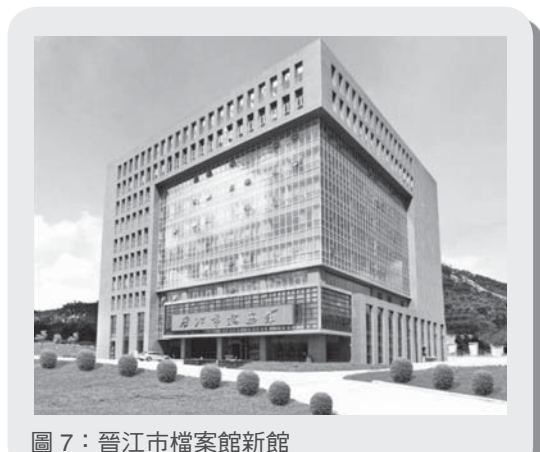
圖7：晉江市檔案館新館

資料來源：晉江市檔案信息網，〈晉江市檔案局（館）簡介〉。 http://www.jjdaxxw.com/readnews.asp?id=1258 （25 Jun. 2014）。