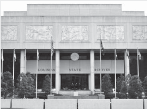
圖 4：路易西安那州立檔案館建築外觀