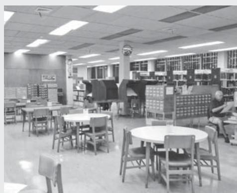
圖 7：紐奧良市公共圖書館閱覽區