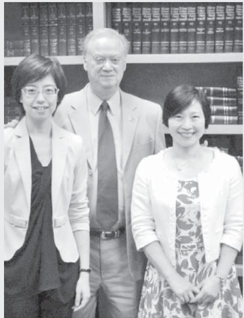
圖 3：路易西安那州州務卿 Tom Schedler（中）與本局林副局長（右）、筆者（左）合影

此外，本次考察團成員在與會期間，亦抽空參訪路易西安那州立檔案館及紐奧良市立公共圖書館（圖 3 至圖 7）。路易西安那州立檔案館自 1956 年成立，設館長 1 人綜理館務，組織依業務性質分為圖書館暨研究部門、檔案保存與徵集部門、文件管理部門、數位媒體部