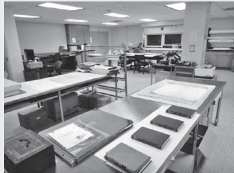
圖 5：路易西安那州立檔案館修復室