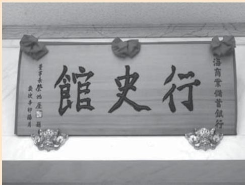
圖 1：上海商銀行史館牌匾

在行政隸屬上，上海商銀的行政體系以總行為核心，總行包括董事長、總經理，總經理下隸有執行副總，負責統轄所有的單位，包括營業單位與管理單位，前者係一般在外面看到的那些分行，後者則如人事處、總務處等，另有高階幕僚單位統稱為總管理處，其秉承高階的指示去處理專辦業務，其下有策略規劃、策略專案、大陸金融、高層秘書等幾個部分，其中策略規劃下則包括公關、研究發展、客戶關係管理與行史及史政管理等，見圖 3。上海商銀行史館即係隸屬於行史及史政管