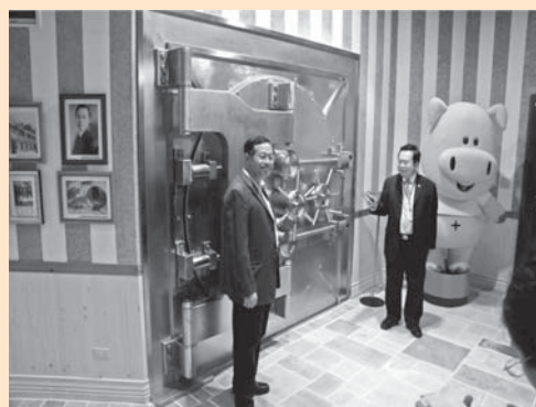
圖 5：上海商銀行史館多媒體區大門