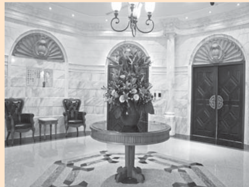
圖 2：上海商銀行史館大廳