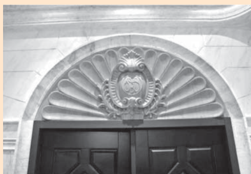
圖 4：上海商銀行史館各區門廳大門綴以不同時期行徽

為 12 坪左右，規劃費用約為新臺幣 4,000 萬，館內多結合該行大陸時期歷史建築特色（見圖 4）或體現銀行經營，如多媒體區大門即仿建大陸舊金庫大門（見圖 5），讓人深刻感受銀行特色。在溫溼度控制部分，溼度係 24 小時控制，溫度則採中央空調，下班後就關閉，庫房中溫度則仍維持在攝氏 22 度左右，採取如此折衷做法原因在於節省電價成本，空調因此無法全天候開啓。該館的消防系統則係與大樓共同的系統，包括滅火器或者是消防演習都是整個大樓同一個時段一起更新或進行，但火災偵測器則係與保全系統獨立於大樓，包括煙霧偵測器、溫度偵測器等。