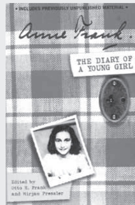
圖 3：安妮·弗蘭克日記原稿

( http://www.nl.go.kr/exhibition/onexhibit/exhibition_theme.jsp?exh_id=EXH2012001&theme_id=2442&subtheme_id=2446&exh_div=ing&exh_div_sub=2 ) (12 Sep.2012).