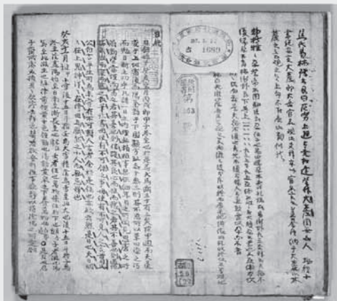
圖 2：日省錄，為紀錄韓國 1760-1910 年的編年體史書

資料來源："Exhibitionibithon," National Library of Korea Website,