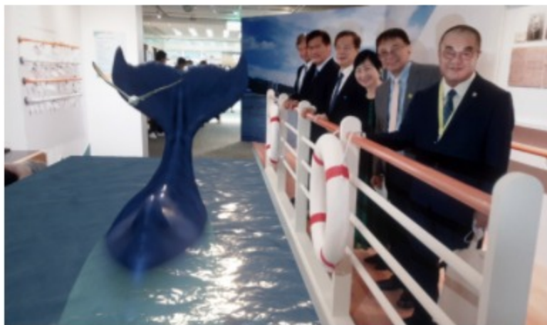
與會貴賓參與AR體驗，與海豚和鯨魚互動