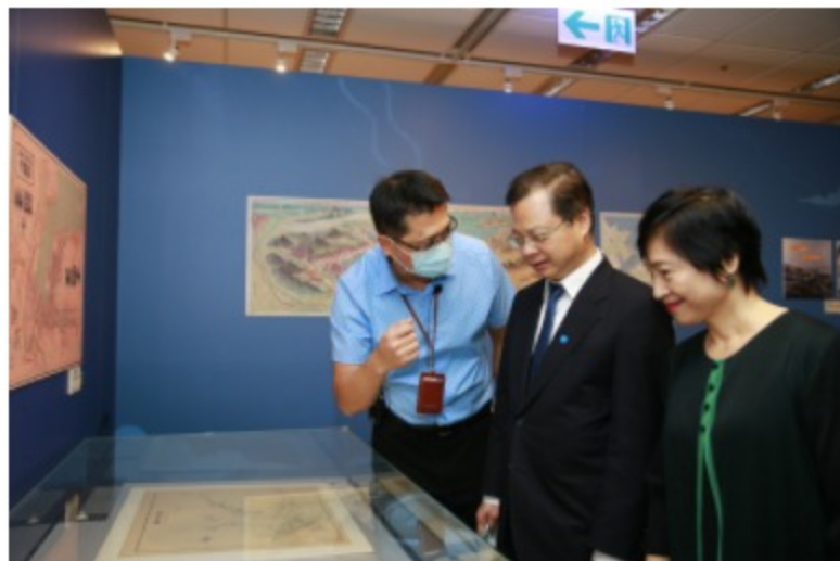
國家發展委員會主任委員龔明鑫(圖中間)參觀展覽