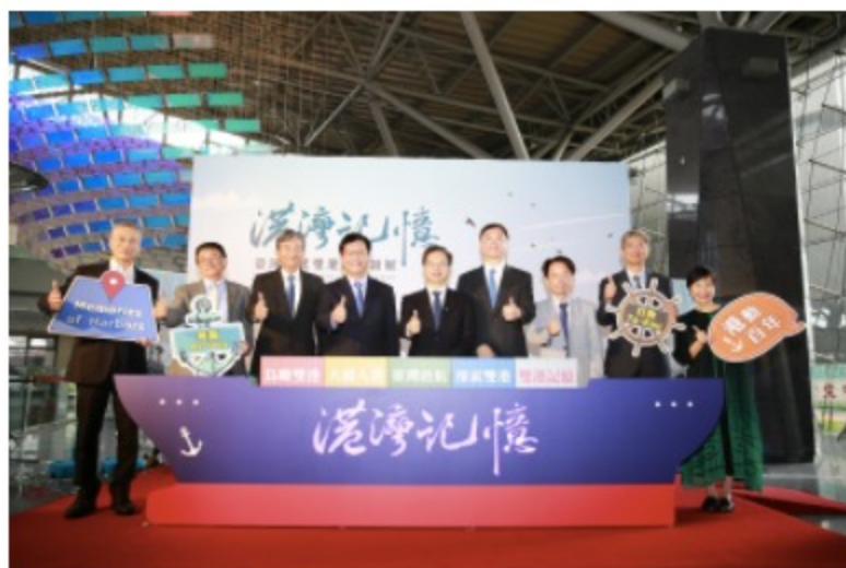
由左至右：港務公司總經理陳劭良、國家運輸安全調查委員會主任委員楊宏智、基隆市副市長林永發、交通部部長林佳龍、國家發展委員會主任委員龔明鑫、高雄市副市長羅達生、國史館館長陳儀深、航港局局長葉協隆、國家發展委員會檔案管理局局長林秋燕共同揭開序幕

本局年度大展「港灣記憶—臺灣南北雙港檔案特展」，於109.10.22舉辦開幕典禮，由國家發展委員會龔明鑫主任委員、交通部林佳龍部長、高雄市羅達生副市長、基隆市林永發副市長、國史館陳儀深館長、國家運輸安全調查委員會楊宏智主任委員、航港局葉協隆局長、港務公司陳劭良總經理及檔案管理局林秋燕局長共同揭開序幕，宣告本次特展快樂出航囉！展期至110.05.31，還有現場參觀填問卷抽獎活動，快來跟我們一同穿越時空、體驗南北雙港港灣記憶吧！