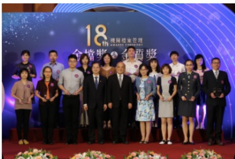
第18屆金檔獎獲獎機關代表(左圖)暨金質獎獲獎人員(右圖)與行政院蘇院長貞昌(前排中)及國家發展委員會龔主任委員明鑫(前排左四)合影