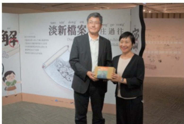
客家委員會楊主任委員長鎮、國家發展委員會檔案管理局林局長秋燕合影

客家委員會楊主任委員長鎮及國立故宮博物院吳院長密察分於109.08.18、08.21率員至局參觀「解密淡新檔案—客庄過往特展」。