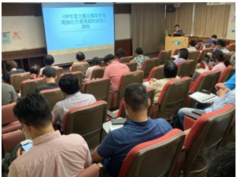
與會學員上課情形