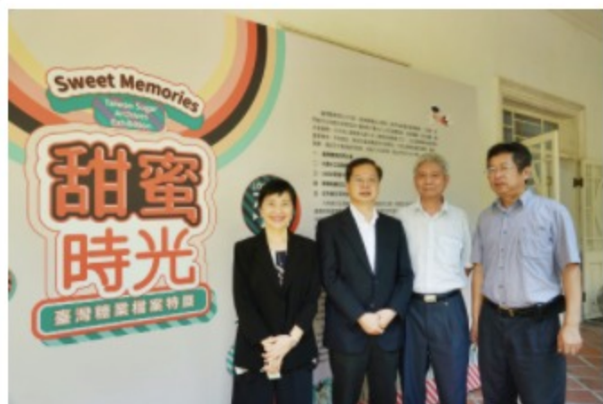
國家發展委員會龔主任委員明鑫(左2)、台灣糖業股份有限公司王總經理國禧(右2)、台灣糖業股份有限公司高雄區處洪經理天財(右1)、國家發展委員會檔案管理局林局長秋燕(左1)合影