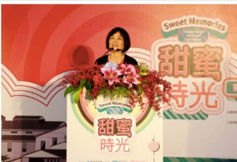
國家發展委員會陳主任委員美伶於開幕儀式致詞

本特展於108.10.23舉辦開幕典禮，由國家發展委員會大家長陳美伶主任委員、國立故宮博物院吳密察院長、台糖公司陳昭義董事長、檔案局林秋燕局長及與會貴賓一起揭開序幕，和大家一起透過檔案回味那段甘蔗田遍布、五分車穿梭、糖廠忙碌製糖的年代。展期至109.05.29，歡迎大家相揪來 看展 喔！