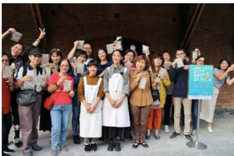
北區與會人員開心地展示製紙成果