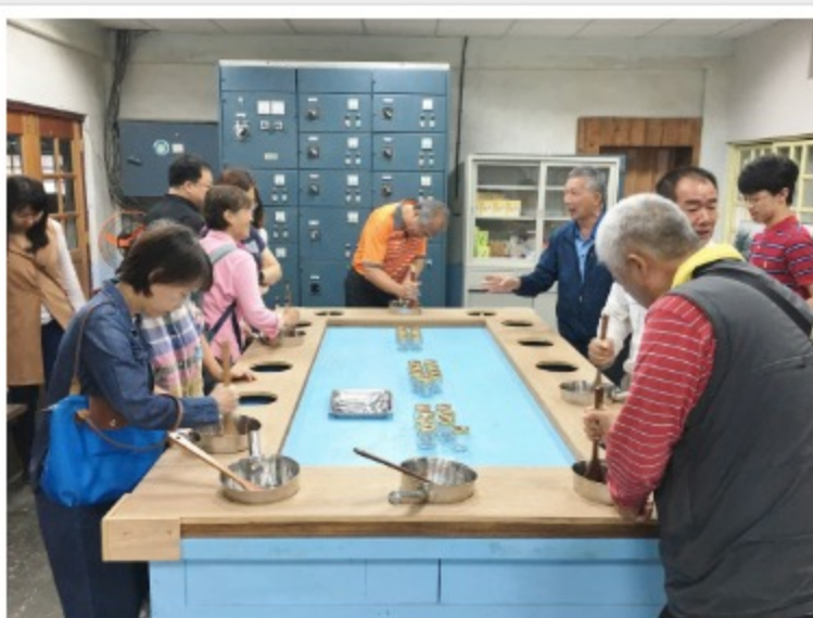
東區與會人員製糖體驗