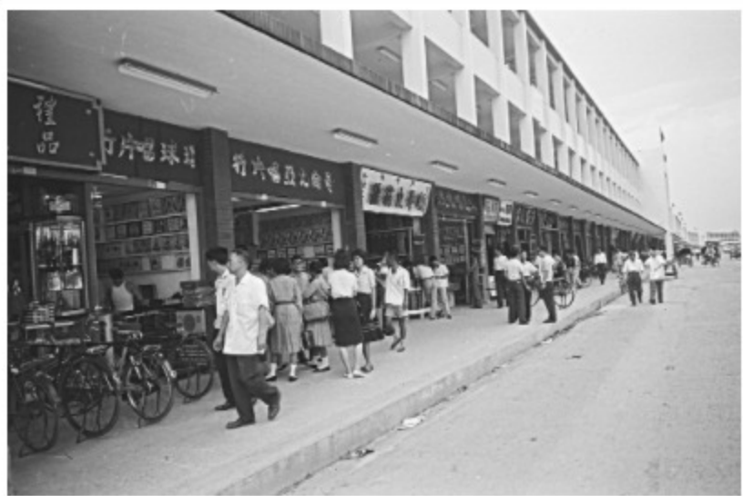
圖15 中華商場「信」棟一樓的景觀 案名：1961農復會照片 檔號：0050/0008/1

「萬雅齋」及「李大吉禮品行」也是中華商場的特色店家，「萬雅齋」藝品店抓住古玩生意商機，推出的商品新奇有趣、五花八門，受到日本及美國客人的青睞。如需開店的紅布條或各式各樣錦旗、獎盃、獎牌與禮品都可找「李大吉禮品行」，這些需求轉變也象徵社會的進步。除此之外，販售電器用品、相命堪輿店舖及茶館等商家也吸引人潮造訪，為中華商場帶來蓬勃的生命力。