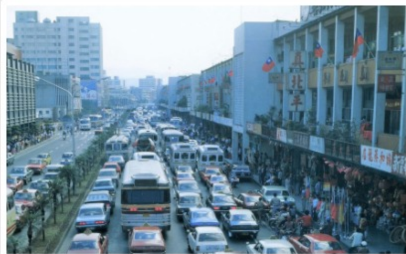
圖14 中華商場二樓「真北平餐館」招牌 案名：服裝、飲食、運動休閒 檔號：0065/2016/1 來源機關：行政院新聞局 管有機關：國家發展委員會檔案管理局

至今，許多人回憶起中華商場，對「義」棟美食店家的好味道難以忘懷，1樓的「點心世界」販賣鍋貼、蒸餃等北方麵食，還有酸辣湯與冰豆漿，店內45度角擺放的四方木頭桌椅更是經典。同屬北方小吃的尚有2樓「真北平餐館」（圖14），以北平片皮烤鴨聞名，不論小酌或宴席菜都能滿足顧客需求，酸菜白肉鍋及軟兜代粉更讓外省老兵一解鄉愁。「愛」棟2樓「溫州大餛飩」，手作薄麵皮包覆著獨門餡料，大小適中餛飩美味令人垂涎三尺。在「愛」棟，還有成衣店家，舉凡學生制服、結婚西裝，當時最流行的喇叭褲、AB褲都一應俱全。西門町是早期電影、歌舞廳、紅包場與戲劇發源地，因地緣關係服裝出租店也在中華商場內開業，如「樂舞戲劇舞蹈服裝社」專門租借舞蹈、戲劇服裝，以因應國內戲劇舞蹈文藝活動之昌盛。由此可見，從傳統到現代服裝，中華商場都能兼容並蓄。值得再提的是，中華商場也是流行音樂的指標，這裡的唱片行能夠滿足各年齡層的需求，「信」棟擁有最多唱片行，也最令人流連忘返。例如「哥倫比亞唱片行」靠近天花板的展示櫃有明星照片，販售黑膠唱片是該店特色之一；在2樓的「佳佳唱片行」有2間店面，總是吸引排隊人潮，除了黑膠唱片還有錄音帶、光碟唱片，西洋樂、流行樂與古典樂應有盡有（圖15）。總之，中華商場呼應著唱片行繁榮時刻，更成為孕育音樂人的搖籃。