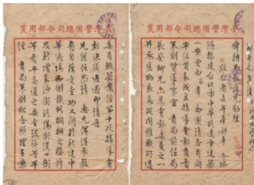
圖1 臺灣警備總司令部副司令李立柏與臺灣鐵路管理局陳舜珩局長往來文件 案名：中華路違建房屋整建中華商場案 檔號：0050/933/007 來源機關：交通部臺灣鐵路管理局 管有機關：國家發展委員會檔案管理局

1949年底，政府撤退至臺灣，許多軍民朋友隨著來到臺北，其中部分暫時在鄰近西門町的中華路鐵路兩側搭建簡易竹棚，棚戶區租金低廉，湧入越來越多人口，久而久之違章建築林立，不僅破爛不堪，甚至影響市容，更嚴重危及交通、衛生安全，有礙觀瞻。1959年，蔣中正總統指示應澈底整頓，臺灣警備總司令部邀集相關單位策劃督導暨協調事宜，並組織整建委員會（圖1、圖2）。