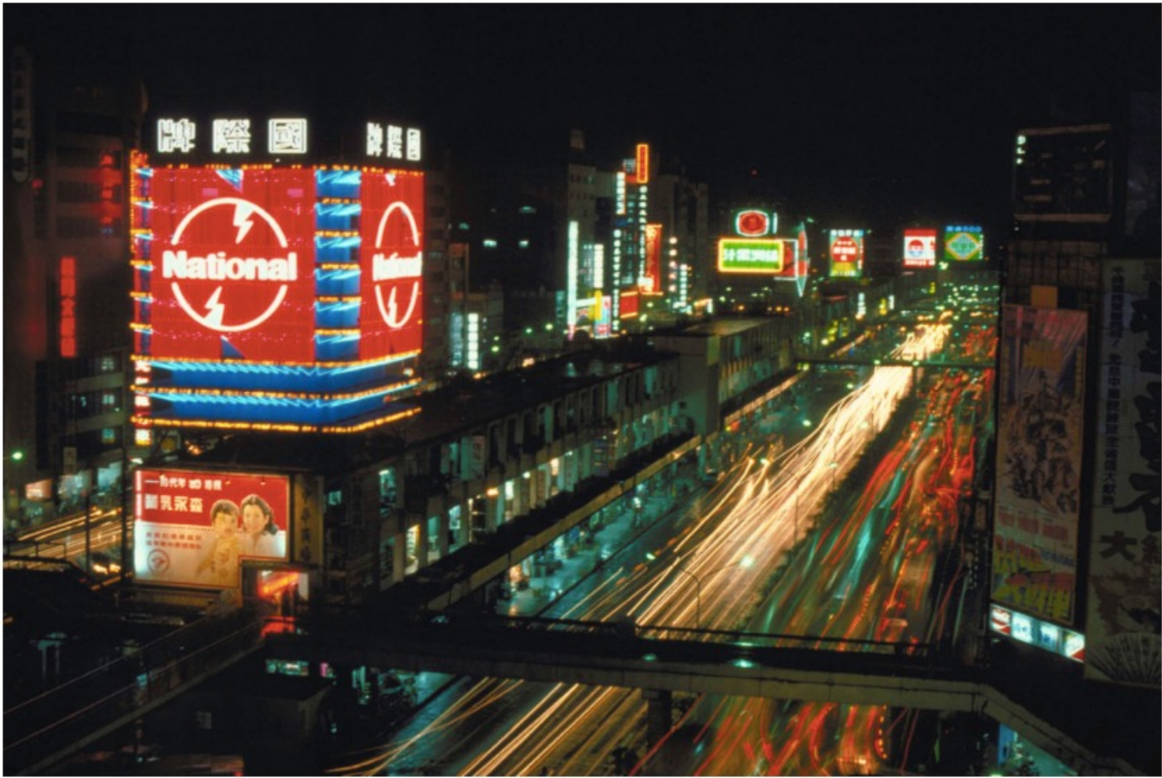
圖12 臺北市中華商場夜景 案名：學生活動、花園前哨-金門、今日臺北幻燈片、中華美食展、校園生活、民間藝術 檔號：0080/BS55/1

1960至1970年代是中華商場鼎盛時期，原本規劃1樓為店面，2、3樓為住家，隨著商場蓬勃發展，2樓也漸漸改為店面。1964年，「松下電器」公司在信棟南端樓頂搭建巨型霓虹燈箱招牌，「大同電器」及「和成衛浴」也架設霓虹燈廣告，閃爍的霓虹燈成為中華商場燦爛的夜景，也是臺北市的標誌（圖12）。1969年，臺北市政府為增進交通安全，興建中華路武昌街行人天橋，銜接「愛」棟與「信」棟。1971年，天橋連接東西向的武昌、漢口、開封街，直通2樓，連貫各棟商場，也讓2樓店家生意興盛起來。在天橋的串聯下，人潮絡繹不絕，這可是中華商場最輝煌的時代。