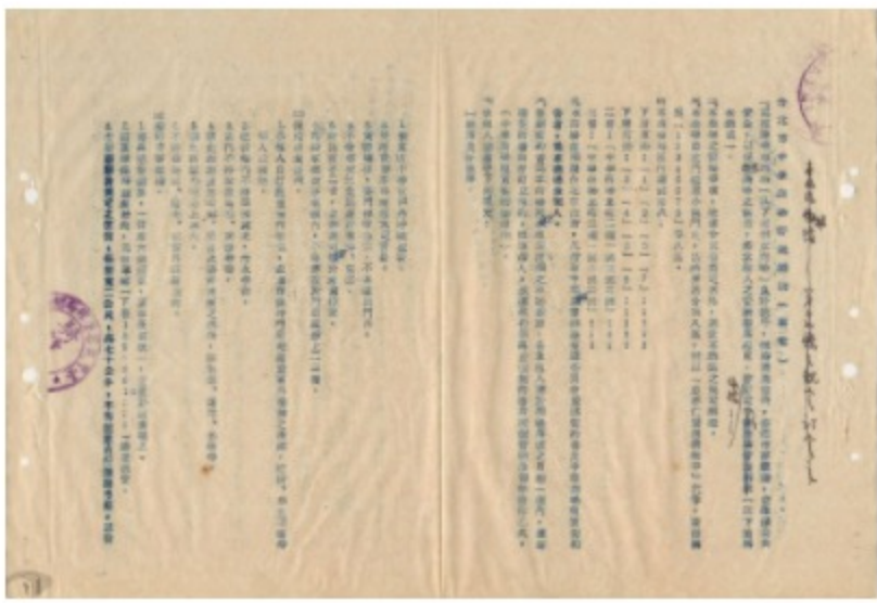
圖5 台北市中華商場管理辦法 案名：中華路連建房屋整建中華商場案 檔號：0050/933/007 來源機關：交通部臺灣鐵路管理局 管有機關：國家發展委員會檔案管理局