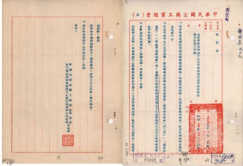
圖10 全國工業總會申請補助經費案 案名：中華商場國貨中心 檔號：0050/04990-005239/00001 來源機關：經濟部 管有機關：國家發展委員會檔案管理局

1962年，全國工業總會在中華商場舉辦十期不同主題的工業新產品示範展覽會，參加廠商計477家，在此期間大同公司展出為人熟知的電扇、電鍋，南港輪胎也參與國產榮譽樣品展示，聯勤國軍遺族化工廠則推出肥皂、藥皂、香皂、牙膏等，這場為期6個多月的盛會也吸引外賓前來參觀(圖11)。