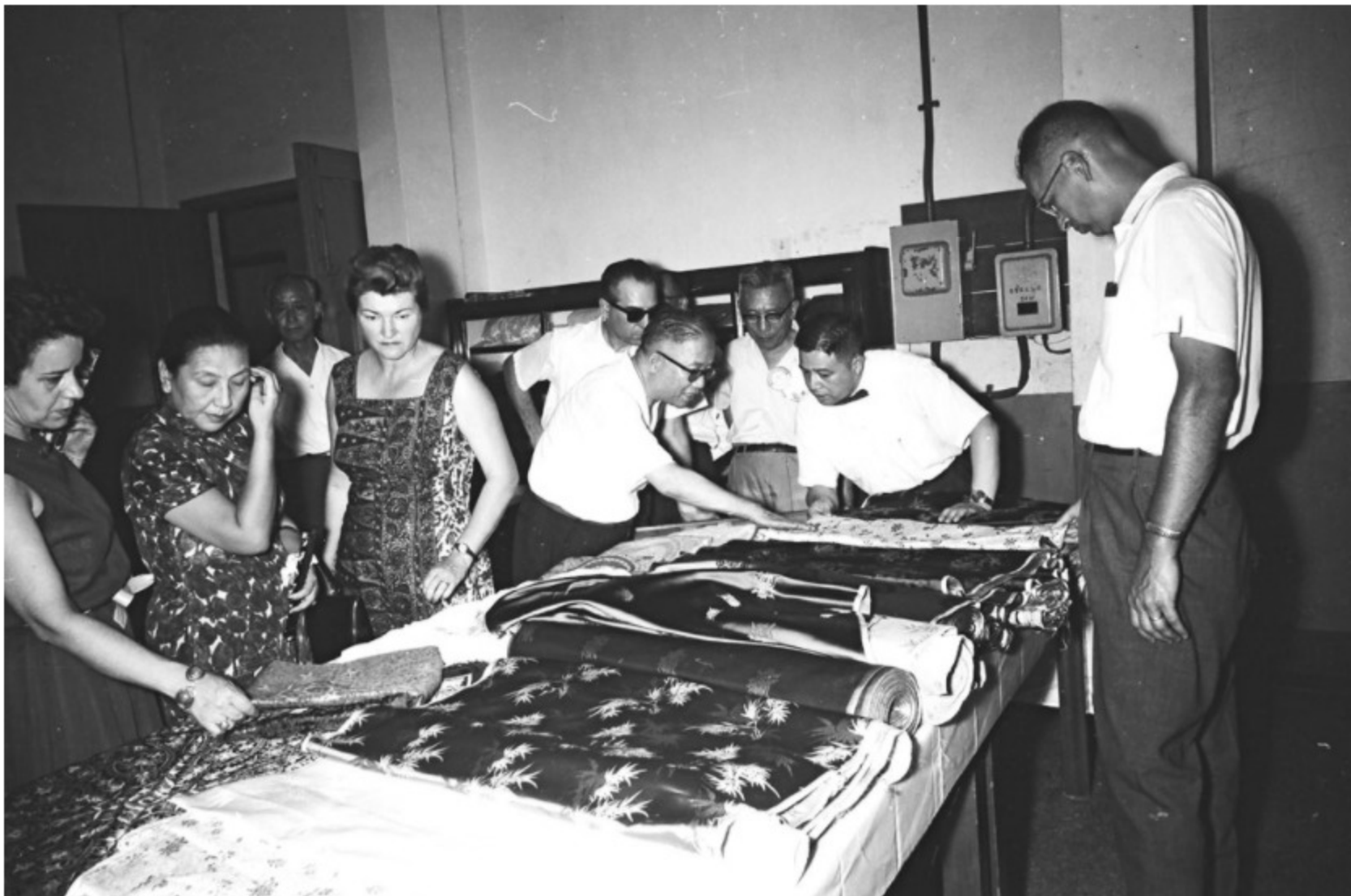
圖11 美國安全分署白慎士署長參觀工業新產品示範展覽會 案名：1962農復會照片 檔號：0051/0009/1

1962年，全國工業總會在中華商場舉辦十期不同主題的工業新產品示範展覽會，參加廠商計477家，在此期間大同公司展出為人熟知的電扇、電鍋，南港輪胎也參與國產榮譽樣品展示，聯勤國軍遺族化工廠則推出肥皂、藥皂、香皂、牙膏等，這場為期6個多月的盛會也吸引外賓前來參觀(圖11)。