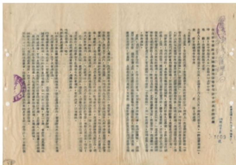
圖2 台北市中華路違章建築整建指導會報十三次會議紀錄 案名：中華路違建房屋整建中華商場案 檔號：0050/933/007 來源機關：交通部臺灣鐵路管理局 管有機關：國家發展委員會檔案管理局

圖1 臺灣警備總司令部副司令李立柏與臺灣鐵路管理局陳舜珩局長往來文件 案名：中華路違建房屋整建中華商場案 檔號：0050/933/007 來源機關：交通部臺灣鐵路管理局 管有機關：國家發展委員會檔案管理局