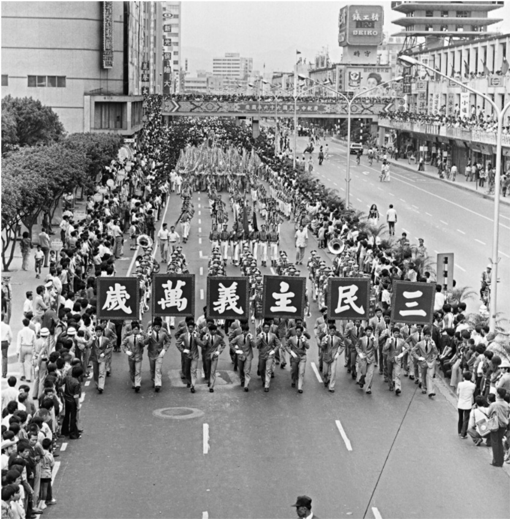
圖13 66年國慶大遊行 案名：各年度國慶 檔號：0060/0074/1

由於中華路鄰近總統府，每年10月國慶閱兵遊行，總是擠滿人潮。中華商場關乎國家門面，依「台北市中華商場管理辦法」的規定，一律懸掛6號鮮豔國旗，置於國旗架上，旗桿長度統一，呈現整齊劃一景象。國慶遊行外，國手奪獎返國的慶賀遊行、紅葉少棒奪金歸國歡迎隊伍，與迎接國際巨星大型活動也常常都在中華路舉行，中華商場成為這些重要活動的場域（圖13）。