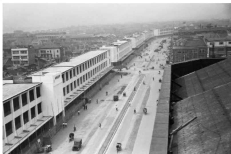
圖3 中華商場落成啟用 案名：1961農復會照片 檔號：0050/0008/1 來源機關：行政院新聞局 管有機關：國家發展委員會檔案管理局

幾經討論後，政府決定「就地整建」，由建築師趙楓設計，陸根記營造廠負責建造，耗費149個工作天，比預定時間提早31天完成，外觀簡潔的鋼筋水泥建築，呈現住商混合的三層樓設計，獲得各界讚賞（圖3、圖4）。為促進中華商場繁榮與承租人之安居樂業，成立「中華商場輔導管理委員會」，訂定「台北市中華商場管理辦法」，規劃自北門起至小南門止，依路界區分，以八德為命名，冠上「忠孝仁愛信義和平」，並得稱為「12345678」等八區。北起忠孝西路口，南至愛國西路口，外觀呈長條狀，以連棟方式排列八座的三層樓水泥建築總共可容納1,644個租戶，也開啟中華商場的光輝歲月（圖5、圖6）。