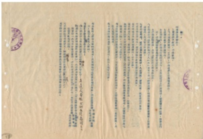
圖6 台北市中華商場管理辦法 案名：中華路連建房屋整建中華商場案 檔號：0050/933/007

1961年4月，中華商場落成後(圖7)，備受各界矚目。工商界為慶祝雙十國慶，宣揚工業產品成果，以及推銷國貨產品，遂由中華民國全國工業總會與中華商場輔導管理委員會聯合在「信」、「義」、「和」、「平」4棟樓區，設立國貨推廣中心，「信」棟商品種類有紡織、電工器材及化工；「義」棟有日用品、手工藝品陶瓷及食品；「和」棟是皮革、水泥及木材；「平」棟商品為一般工業、公營事業及軍需工業產品，所陳列各式商品都是當時最新產品，如同各種產業縮影。國貨推廣中心協助廠商標明商品價格、實施商品不二價、倡導產品標準化及推行禮貌運動，辦理接待外賓、僑胞參觀商場，協辦外銷訂貨作業(圖8、圖9)，藉此推廣國貨，爭取產品外銷與促進經濟繁榮。與此同時，也陳列外國各式商品，展現臺北市躋身國際都市的競爭力。後來，全國工業總會將中華商場規劃為代表國家標準國貨陳列與外銷市場(圖10)，足見其落成時蓬勃生命力，並獲得政府與工商界的高度重視。