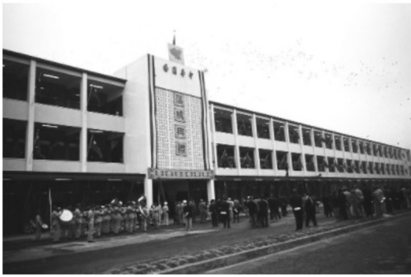
圖7 中華商場落成啟用典禮 案名：1961農復會照片 檔號：0050/0008/1

1961年4月，中華商場落成後(圖7)，備受各界矚目。工商界為慶祝雙十國慶，宣揚工業產品成果，以及推銷國貨產品，遂由中華民國全國工業總會與中華商場輔導管理委員會聯合在「信」、「義」、「和」、「平」4棟樓區，設立國貨推廣中心，「信」棟商品種類有紡織、電工器材及化工；「義」棟有日用品、手工藝品陶瓷及食品；「和」棟是皮革、水泥及木材；「平」棟商品為一般工業、公營事業及軍需工業產品，所陳列各式商品都是當時最新產品，如同各種產業縮影。國貨推廣中心協助廠商標明商品價格、實施商品不二價、倡導產品標準化及推行禮貌運動，辦理接待外賓、僑胞參觀商場，協辦外銷訂貨作業(圖8、圖9)，藉此推廣國貨，爭取產品外銷與促進經濟繁榮。與此同時，也陳列外國各式商品，展現臺北市躋身國際都市的競爭力。後來，全國工業總會將中華商場規劃為代表國家標準國貨陳列與外銷市場(圖10)，足見其落成時蓬勃生命力，並獲得政府與工商界的高度重視。