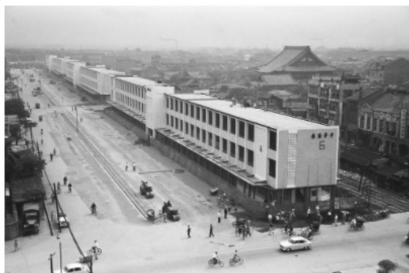
圖4 中華商場鳥瞰 案名：1961農復會照片 檔號：0050/0008/1 來源機關：行政院新聞局 管有機關：國家發展委員會檔案管理局

圖3 中華商場落成啟用 案名：1961農復會照片 檔號：0050/0008/1 來源機關：行政院新聞局 管有機關：國家發展委員會檔案管理局