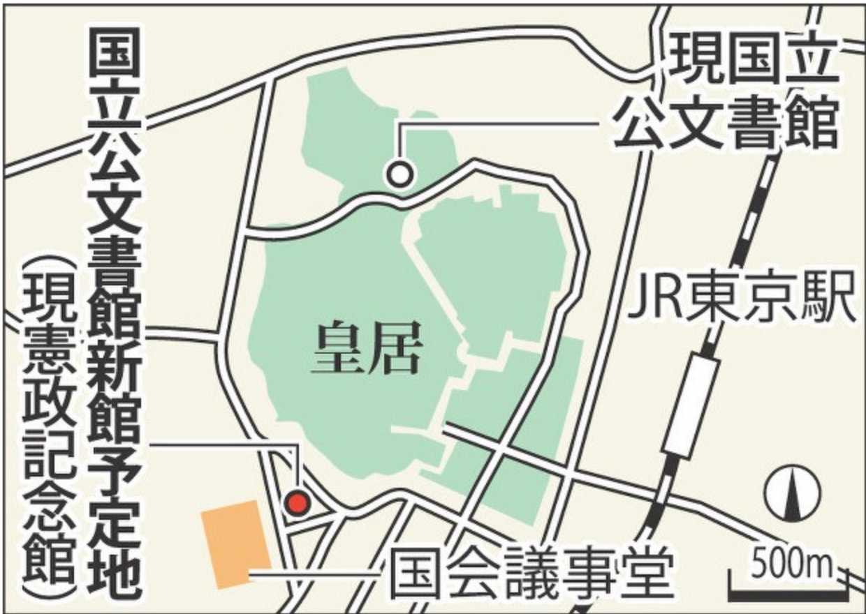
圖2 國立公文書館新館地理位置圖

已有2座館舍的國立公文書館，未來典藏將按公文書的應用情形、保存狀態分別存放，核心業務由3個館分散職掌。由於新館位在首都圈行政中樞，適合成為讓一般民眾親近了解國家發展歷史與認識公文書的文化場域，以及與國內外有關單位交流的洽公地點，國立公文書館的行政與應用服務中樞將位於新館；北之丸館預定轉為支援深度研究需求以及技術研習中心，專職典藏調閱率高、具研究價值的公文書和技術訓練場所；地理位置遠離都心的筑波分館規劃為專門典藏中心，負責保存原件取用率不高以及暫時無法開放應用之檔案。