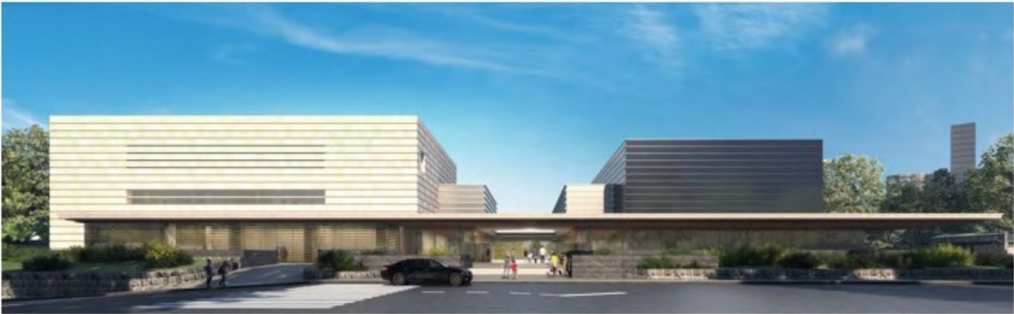
兩館西側外觀（イメージ）

考量建築永續經營的發展性，結構採能維持環境穩定性的建材與提升後續經濟效能的建設設計；由於新館鄰近皇居、國會議事堂等重要建築，建築外觀須遵守東京都景觀條例，衡量與周遭建物景觀的協調性，並考量遠眺的視野均衡度。