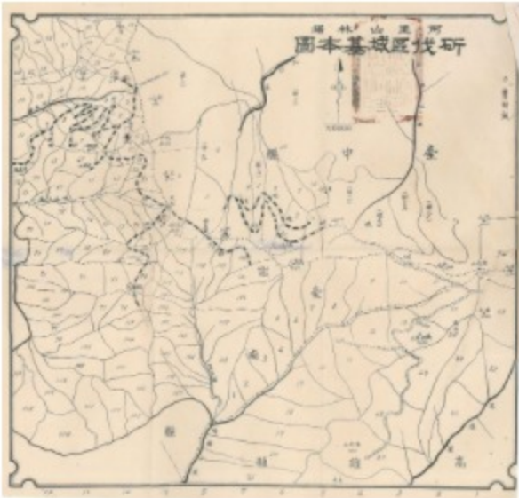
民國37年阿里山林場斫伐區基本圖

政府出版品資訊網為讓各界瞭解本局日常作業與國家檔案的典藏，編輯團隊特別邀訪林秋燕局長。透過此次專訪，不僅撥開國家寶藏神秘面紗，讓各界一窺堂奧，同時也介紹近年來本局開辦的檔案月、檔案特展與精采活動。專訪內容請參見GPI政府出版品資訊網－ 焦點人物 。