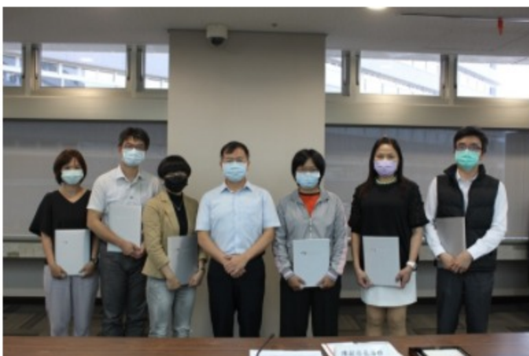
109年檔案志工在職教育訓練暨座談會

為提升本局檔案志工服務知能，本次活動規劃國家檔案整理保管實務作業、南北雙港檔案特展等專題分享，並就服務經驗進行座談，以強化各運用單位及檔案志工們交流及業務經驗分享。