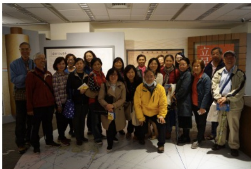
「藏在地圖檔案的故事」專題講座獲熱烈迴響