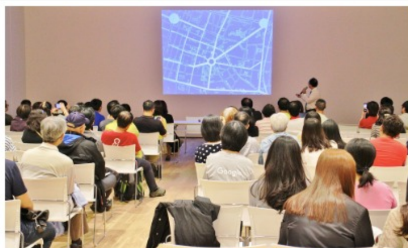
「藏在地圖檔案的故事」專題講座獲熱烈迴響