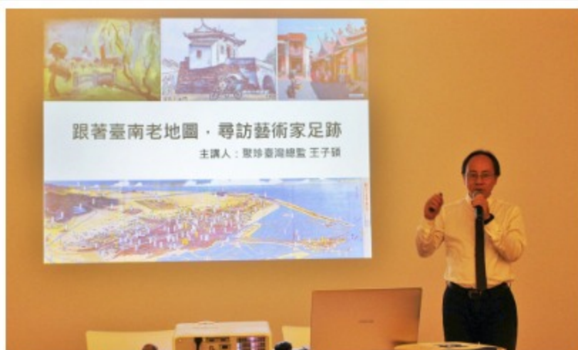
「藏在地圖檔案的故事」專題講座獲熱烈迴響

本局於107.12.08、12.15分別在臺南市美術館及臺中文學館舉辦「藏在地圖檔案的故事」專題講座。透過專家解說介紹臺南藝術家的足跡與戰後初期臺中市的轉變，這些珍貴有趣的地圖故事，均獲得參加來賓的廣大熱烈迴響。