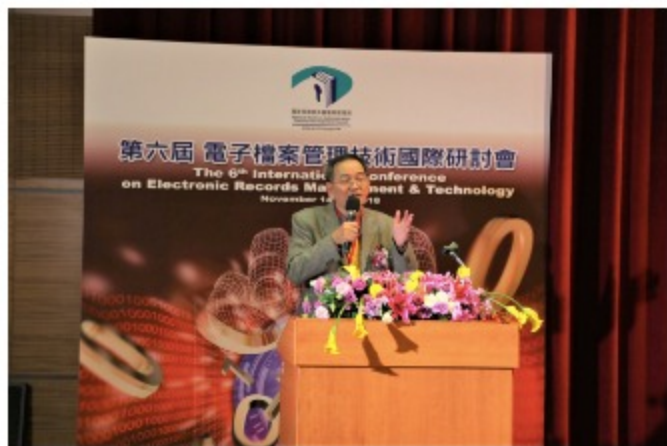
國發會何主任秘書全德蒞臨開幕致詞

由國家發展委員會及客家委員會指導，本局及客家文化發展中心主辦「與地圖的時空對話—國家檔案地圖中的故事」特展，由國發會副主委曾旭正、客委會副主委范佐銘及與會貴賓一起揭開序幕，帶領大家探索國家檔案地圖中的故事。自107.10.24—108.05.31於本局1樓展覽廳展出，歡迎大家一起走進展場探索寶島風華的演進，或欣賞線上展，與這些歷史地圖進行時空對話。展覽廳地址：新北市新莊區中平路439號北棟1樓。