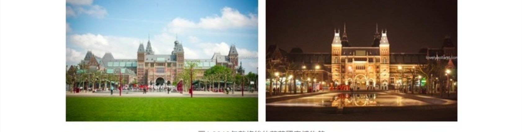
圖1 2013年整修後的荷蘭國家博物館

該館曾歷經多次搬遷，現址位於荷蘭首都阿姆斯特丹。2003年，該館斥資約新臺幣150億(約3.75億歐元)大舉翻修，原本預計2008年完工，未料碰上水患及種種糾紛，延遲至2013年方告完竣(圖1)。歷經10年之久的修繕過程，該館將其拍攝成紀錄片，並獲頒阿姆斯特丹國際紀錄片影展(International Documentary Film Festival Amsterdam)最佳荷蘭紀錄片及隆德國際建築影展(Lund International Architecture Film Festival)最佳紀錄片等大獎。