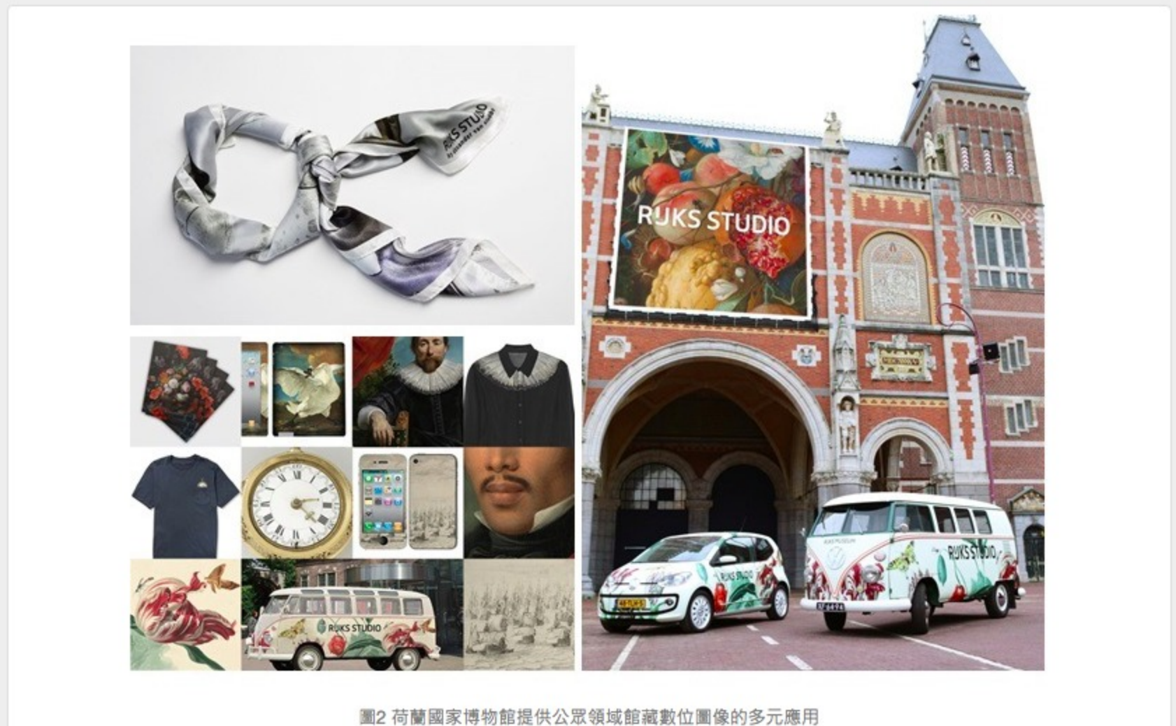
圖2 荷蘭國家博物館提供公眾領域館藏數位圖像的多元應用

儘管如此，販售高階圖像下載雖可獲得收入，但仍不敷投入數位化作業之成本。因此，該館於2013年轉變授權及收費方式，改於網站免費提供公眾領域館藏數位圖像的下載，並建置Rijksstudio計畫網站( https://www.rijksmuseum.nl/en/rijksstudio )，讓使用者可以輕易的在其網站自行重新組織館藏或利用館藏進行創作，像是改編藝術作品、設計專屬自己的資料夾、衣服、手機殼等(圖2)。