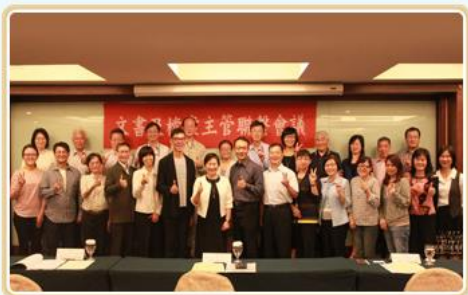
106年文書及檔案主管聯繫會議(中央機關場次)分組合影

為提升文化商品之能見度及推廣性，本局自106.10.20起在本局1樓展覽廳設置文化商品展售區。首波上架商品計14品項、18件，無論是拼圖、餐墊，或書籤、馬克杯等，均呈現以檔案元素創意加值的巧思。歡迎各界參觀選購，即日起至106.12.31止，凡是消費即致贈精美的「時貳廳：電影與檔案的初邂逅」DVD 1份。詳細資訊請 上網 參閱並歡迎選購。