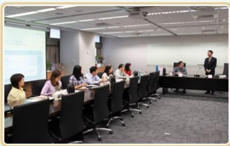
臺灣電力公司秘書處同仁與本局交流