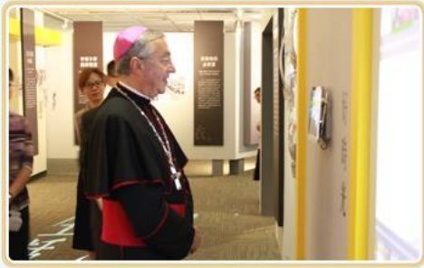
布魯格斯總主教參觀本局特展