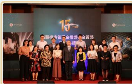
國家發展委員會曾副主任委員旭正（前排中）與金質獎獲獎人員合影