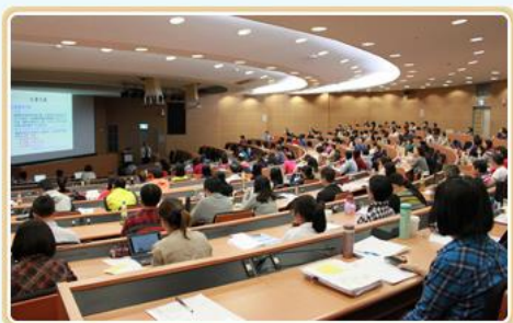
106年檔案管理研習班研習

本局為了促進中央一級、二級機關主管文書與檔案管理單位之間的聯繫，於106.11.15在公務人力發展中心福華國際文教會館舉辦「106年文書及檔案主管聯繫會議 (中央機關場次)」，與會夥伴除聆聽專題演講並分享標竿實務經驗，更藉由實務議題的討論，彼此互動交流，不僅增溫友好關係，也有效增進檔案管理作業質量。