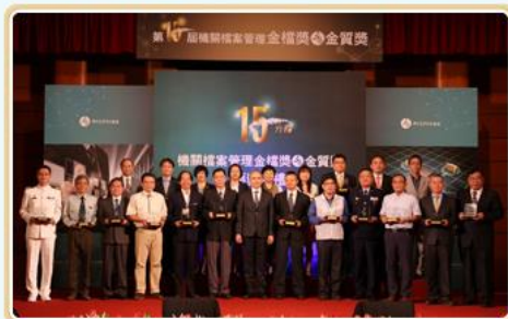
國家發展委員會曾副主任委員旭正（前排中）與金檔獎頒獎代表合影

第15屆金檔獎暨金質獎頒獎典禮於106.10.19在國家圖書館國際會議廳舉辦，國家發展委員會曾副主任委員旭正代表行政院院長蒞臨致詞並頒獎，除了對獲獎機關與人員表達高度肯定與誠摯祝賀外，也期勉大家發揮巧思，讓檔案應用融入在地文化等元素，讓更多民眾認識檔案，善用檔案。