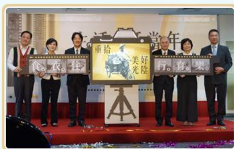
行政院賴院長清德（左3）、國史館吳館長密察（右3）、文化部鄭部長龍君（左2）、國家發展委員會陳主任委員美伶（右2）、原住民委員會黃將「拔路兒」主任委員（左1）、行政院發言人國勇（右1）共同揭幕

國家發展委員會與國史館指導，本局與國史館臺灣文獻館主辦之「生活·話當年—1950、1960年代國家檔案影像特展」，由行政院賴院長清德揭幕。透過一幅幅老照片與各種互動設施，彷彿回到1950、1960年代，感受當時的食衣住行育樂。展覽自106.10.20—107.06.01於本局1樓展覽廳展出，歡迎大家一起走進展場穿越時光迴廊，或欣賞線上展，體驗當年庶民生活的點點滴滴。展覽廳地址：新北市新莊區中平路439號北棟1樓。