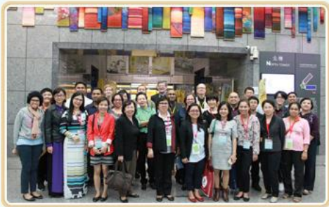
外籍學員於本局1樓展廳前合影

教廷梵諦岡圖書館及機密檔案室總負責人布魯格斯總主教 (Archbishop Jean-Louis Bruguès) 為瞭解我國國家檔案數位典藏、檔案加值應用服務及文檔合一等議題，於106.11.02蒞局參訪。