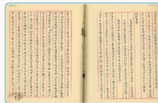
圖7 日人圖謀擅自駛離廣源輪 案名：廣源輪案 檔號：0026/443.4/0026 來源機關：外交部 管有機關：國家發展委員會檔案管理局