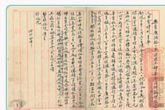
圖13 總領事館將廣源輪售予澳商 案名：廣源輪案 檔號：0026/443.4/0029 來源機關：外交部 管有機關：國家發展委員會檔案管理局

整體而言，我國力爭廣源輪案衍生的船隻國籍歸屬、船員鬥毆，以及廢鐵爭議都大獲全勝。廣源輪案不僅是抗戰初期我國對日外交之一大勝利，更轟動國際社會、備受矚目，成為日後國際法爭論援引的經典案例。歡迎利用國家檔案資訊網查詢相關紀錄，瞭解當年廣源輪案精彩論辯歷程，見證這樁決戰千里外的抗戰「船」奇。