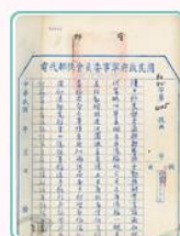
圖9 我國依據軍事徵用法徵用廣源輪 案名：廣源輪案 檔號：0027/443.4/0028 來源機關：外交部 管有機關：國家發展委員會檔案管理局