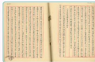
圖6 廣源輪轉賣日商爭取放行 案名：廣源輪案 檔號：0026/443.4/0026 來源機關：外交部 管有機關：國家發展委員會檔案管理局

總領事館並請從事漁業之華僑協助，監視廣源輪一舉一動。27年1月，日籍船長河野古助等人將廣源輪駛進船塢修繕機件，核對羅盤與各項儀器，準備蓄勢待發。總領事館接獲消息，為防止船長駕船逃離，立刻通知美國緝私艦上船盤檢，強調廣源輪是我國籍船隻，倘若未能夠依照合法的手續申請，擅自駛離船隻，緝私艦可以依照國際法規定，視作海盜行為予以砲擊(圖6、圖7)。