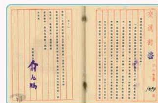
圖5 交通部建議總領事館保留廣源輪國籍證書