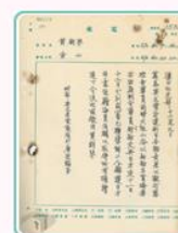
圖10 總領事館協助處理華籍船員與日方衝突 案名：廣源輪案 檔號：0026/443.4/0026 來源機關：外交部 管有機關：國家發展委員會檔案管理局

28年5月，廣源輪尚無法駛離舊金山，日本橫濱正金銀行向美國聯邦地方法院聲請扣押2,000餘噸廢鐵，准許其移船提貨，致使該案再掀爭議。經雙方角力後，法院判定廢鐵雖屬橫濱正金銀行所有，但廣源輪係屬我國所有，日方不能移船提取廢鐵，報刊紛紛報導該項消息(圖11)。29年6月，總領事館以廣源輪訴訟與保管費用日積月累，實已不堪負荷，新任總領事馮執正提出出售船隻，並審慎思考如何處理船上廢鐵(圖12)。40年1月，總領事館將廣源輪出售澳洲商人，要求不得再將該船售予日本，至於廢鐵由買方與橫濱正金銀行商洽補償辦法，並依規定在美國鑄鑄以防止日軍利用(圖13)。