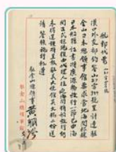
圖8 日人未能將廣源輪擅自駛離舊金山 案名：廣源輪案 檔號：0026/443.4/0026 來源機關：外交部 管有機關：國家發展委員會檔案管理局