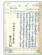
圖1 黃朝琴請示外交部處理廣源輪辦法 案名：廣源輪案

駐舊金山總領事黃朝琴仔細審查各項文件，得知20名華籍船員正在美國移民局看守所等待上岸接船，但船上卻有日籍船長、輪機長與大副3人，船隻載運一批重達2,000餘噸廢鐵，預計先啟航前往日本大阪，再折抵煙臺。時值我國與日本已進入全面戰爭狀態，黃朝琴認為廣源輪形跡可疑，可能遭到日本或漢奸控制，遂於9月1日電報請示外交部(圖1)。