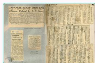
圖11 報刊報導日方無法提取船上廢鐵 案名：廣源輪案 檔號：0026/443.4/0027

28年5月，廣源輪尚無法駛離舊金山，日本橫濱正金銀行向美國聯邦地方法院聲請扣押2,000餘噸廢鐵，准許其移船提貨，致使該案再掀爭議。經雙方角力後，法院判定廢鐵雖屬橫濱正金銀行所有，但廣源輪係屬我國所有，日方不能移船提取廢鐵，報刊紛紛報導該項消息(圖11)。29年6月，總領事館以廣源輪訴訟與保管費用日積月累，實已不堪負荷，新任總領事馮執正提出出售船隻，並審慎思考如何處理船上廢鐵(圖12)。40年1月，總領事館將廣源輪出售澳洲商人，要求不得再將該船售予日本，至於廢鐵由買方與橫濱正金銀行商洽補償辦法，並依規定在美國鑄鑄以防止日軍利用(圖13)。