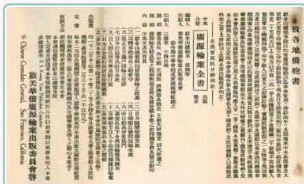
出版《廣源輪案》一書(註1)