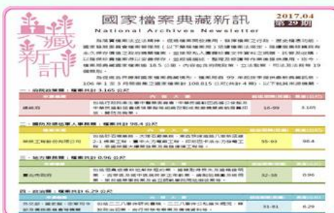
「國家檔案典藏新訊」第29期首頁

為透過廣播之教育功能，有效擴展國家檔案服務訊息，本局與國立教育廣播電臺臺北總臺共同製作「聽檔案，說故事」節目單元，並於106.04.28上午10時05分於該電臺之「生活In Design(下)」節目播出，本次節目主題為「伴隨臺灣農青成長的四健會」，將介紹昔時四健會如何推廣農村教育運動，訓練農村青年具備科學技能，歡迎線上收聽。