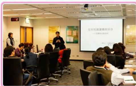
宜蘭縣史館廖館長英杰專題演講情形

本局為提升志工專業服務之知能，並凝聚志工服務熱忱，強化各運用單位及志工們之彼此交流與分享經驗，特於106.03.22辦理檔案志工在職教育訓練暨座談會，表揚105年優良志工，並邀請宜蘭縣史館廖館長英杰蒞局專題演講。