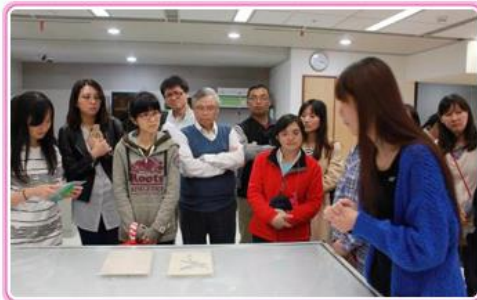
檔案基礎實務班學員參觀本局紙質檔案修護室情形