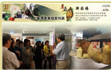
民眾參觀「農為國本—臺灣農業檔案特展」情形

本局於106.02.20邀集公文檔案管理系統相關廠商，說明新版公文及檔案管理資訊系統驗證規格(NAA EDRMS—2：2015)草案內容，聽取實務界聲音，並徵詢參與試辦意願，以利新版規格之訂定。