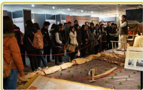
國家文官學院學員參觀本局展覽情形