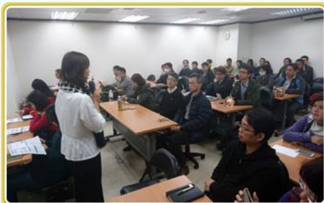
新版文檔系統驗證規格草案廠商說明會

國家文官學院「105年公務人員高等考試三級考試暨普通考試一般行政類科錄取人員專業法令集中實務訓練」參訓學員共190名，為瞭解檔案管理應用及參觀檔案展，於106.02.23參觀本局國家檔案閱覽中心、常設展廳暨展覽廳。