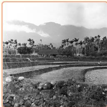
圖7 稻田養魚 檔號：0038/002/1 案名：農村生活一景

農復會不僅針對臺灣農業的需求深入研究，其輔導形式也切合需求並富於變化。張訓舜曾任農復會委員，提到農民稻穀常因下雨而無法曬乾，當時若使用稻穀烘乾機則成本過高，農民也須具備豐富的機械知識，最簡單的方法是以水泥曬場來解決困難。農復會隨即補助全臺各地農會，鋪設一千多座水泥曬場(圖8)，以為因應。