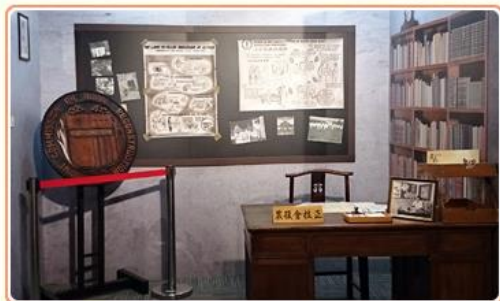
農為國本—臺灣農業檔案特展一隅