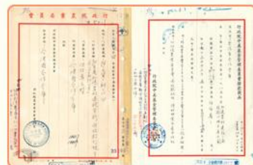
圖3 由農發會改組為農委會暨資金來源為中美基金 檔號：0073/251.13/1 案名：加速農村建設貸款 來源機關：合作金庫銀行股份有限公司 管有機關：國家發展委員會檔案管理局

農復會遷至臺灣後，首要挑戰是糧食增產，其可分為農、漁、牧三方面。農業增產大致有兩種方式，一是提高單位面積產量，一是擴展種植面積；就前者而言，農復會除了協助推廣優良種子並進行品種改良之外，亦調撥供應化學肥料及撥款補助農家修建堆肥室，數量高達一萬五千所。在擴展種植面積方面，農復會在臺北三芝、陽明山及南投東埔、霧社等山地種植高冷蔬菜，產季在7-10月，補充平地蔬菜所不足的需求量。至於中橫開闢時期，農復會為供應修路工人蔬菜需求，輔導原住民在梨山栽植高冷蔬菜，此即著名梨山高麗菜的由來(圖4、圖5)。