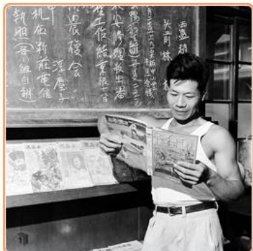
圖9 早期豐年雜誌採用大型版面 檔號：0044/0002/1 案名：閱讀豐年雜誌 來源機關：行政院新聞局 管有機關：國家發展委員會檔案管理局

至於宣傳方面，農復會更是不遺餘力地推展。在40年創辦《豐年雜誌》(圖9)，同年7月15日發行首期《豐年半月刊》，還開拍多部以農民及農村生活為背景的电影(圖10)，製作許多農業廣播節目(圖11)(註4)。然因農民不常看电影，而收音機的售價太高，平面文宣相對廉價又便利。因此，最深入農村的宣傳模式就是《豐年半月刊》的發行。它是臺灣第一份專為農民閱讀所設計的雜誌，內容包含時事、技術與家政等面向，並以大量圖畫呈現。由於政府允許創刊5年內，可採中日文對照刊登，這對多數受過日本教育的農民來說，閱讀上並無障礙，使得發行量迅速增長。農復會對臺灣農業的貢獻尚有許多，若想進一步瞭解，歡迎利用國家檔案資訊網查詢相關檔案，發掘臺灣農業發展之歷程。