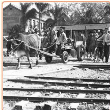
圖10 民國44年上映電影《農家好》拍片場景 檔號：0044/0002/1 案名：拍攝紀錄片場景 來源機關：行政院新聞局 管有機關：國家發展委員會檔案管理局