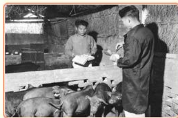
圖6 畜產專家為豬隻進行人工授精 檔號：0041/0021/1 案名：種豬人工授精

協助漁業增產方面，可概分為二方面，一是朝向海洋發展，撈捕魚鮮。農復會每年編列預算，透過低利貸款，協助漁民購買船用引擎及合成纖維漁網。其次，養殖漁業則推廣在稻田養殖吳郭魚，雖成效不彰，卻引發部分農民養魚的興趣，將田地闢建成魚塢，轉而從事養殖漁業(圖7)。