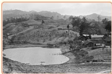
圖4 梨山高山農場開墾初期景象 檔號：0056/0060/1 案名：梨山開墾照

在畜牧業的增產方面，農復會注重豬隻品種的改良，著力於引進外國豬隻與本土豬隻進行雜交，以獲得長得快且繁殖力佳的新品種；並透過補助畜產試驗所，在全臺設置5個工作站，從事豬隻人工授精(圖6)。40年代的臺灣交通並不方便，偏遠農村常無法即時配種，為解決此一難題，農復會開發出「飛鴿傳精」！訓練信鴿在距離50公里以內的範圍，於一日之際往返於授精中心與授精站，即時傳遞畜種。