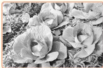
圖5 梨山高山農場的高麗菜 檔號：0055/0013/1 案名：高麗菜