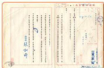
圖2 經濟部農業局71年風災貸款 檔號：0071/251.2/1 案名：社團放款 來源機關：合作金庫銀行股份有限公司 管有機關：國家發展委員會檔案管理局