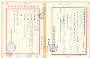
圖1 由農復會改組為農發會暨資金來源為中美基金 檔號：0073/251.13/1 案名：加速農村建設貸款 來源機關：合作金庫銀行股份有限公司 管有機關：國家發展委員會檔案管理局

在美援時期，各單位送交農復會的計畫，及農復會提出執行的策略，其審核權限主要在美方。美援結束後，經費來源改由中美經濟社會發展基金(簡稱中美基金)支出，農復會的主導權轉由政府掌握。換言之，自54年開始，農復會由政府外部的農業建議及研究機構，逐漸轉為政府農業部門主管單位。68年中美斷交，美方召回兩位美籍委員及其他員工，臺灣保留農復會架構並改組為農業發展委員會(簡稱農發會)，作為中央主管農業部會(圖1)。73年7月20日，為統一事權，再將原設於經濟部的農業局(圖2)與農發會合併，改組成農業委員會(簡稱農委會)(圖3)。