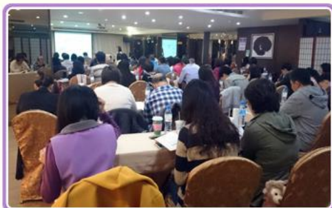
機關檔案管理人員於東部場次研習情形