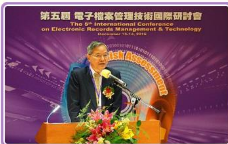
國發會陳主任委員添枝委員開幕致詞

本局於105.12.13—105.12.14在國立臺灣大學法律學院森澤館國際會議廳舉辦「第五屆電子檔案管理技術國際研討會」，國家發展委員會陳主任委員添枝蒞臨開幕致詞，續由本局林局長秋燕率先以「面對資訊時代的文書檔案整合模式與數位變革」專題演講揭開序幕，德國、匈牙利、愛沙尼亞、以色列、香港、泰國的專家們陸續發表精闢之專題演講，大會並安排兩場焦點座談，讓產官學研各界領域學者專家熱絡交流，獲得與會者熱烈迴響。