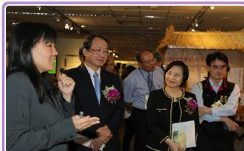
岳修平教授為蒞展貴賓導覽「農為國本—臺灣農業檔案特展」情形