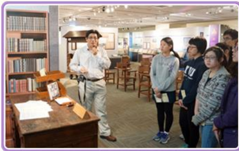
臺大圖書資訊學系師生參觀「農為國本—臺灣農業檔案特展」情形