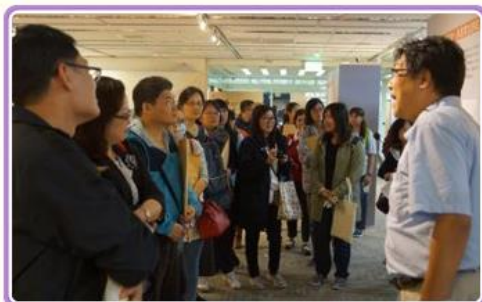
桃園市政府秘書處與民政局參觀「農為國本—臺灣農業檔案特展」情形

為精進各機關文書流程管理制度及提升公文品質與效率，本局自105.10.04起分區辦理三梯次文書流程管理研習會，南部及東部場次分別於11.22、12.06在高雄及花蓮地區舉辦，與會人員討論熱烈，研習會圓滿完成。