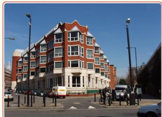
圖2 英國家族檔案中心建築外觀