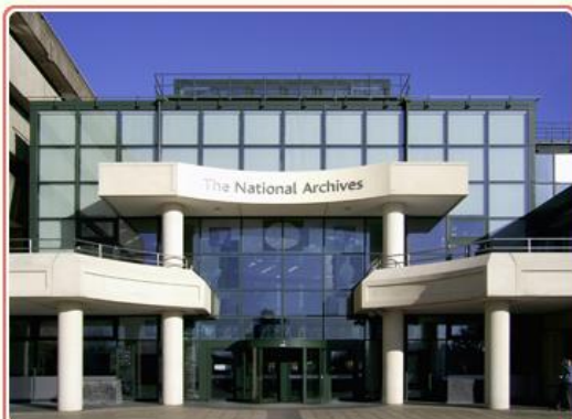
圖1 英國國家檔案局建築外觀

TNA的首要任務為蒐集政府各部門所產生且具永久保存價值之各種載體的檔案資料並提供利用,長期以來,接受全國公共檔案機構、非官方公共檔案館、各部檔案館、教會檔案館、私人檔案館等機構之檔案移轉,檔案種類包括紙質類(如羊皮紙、照片、海報、地圖、素描和油畫)、多媒體類檔案與網站等,最著名的館藏為11世紀(西元1085年)之「末日審判書(The Domesday Book)」,因檔案數量龐大,需要許多專業人力辦理檔案編目建檔及修護等作業,爰召募各專業領域且對檔案歷史具有熱誠之志工加以協助,長達20多年,希冀透過參與志願服務,藉以提升個人資訊使用能力及其他與工作相關的技能,以強化職場競爭力,增進社會參與感,獲得新生活及新人際關係。