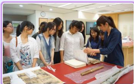
北藝大學生參觀本局紙質檔案修護室

國立東華大學朱副校長景鵬偕同該校公共行政學系高主任長於105.04.29帶領80位學生到局參訪，以瞭解國家檔案保存維護作業及檔案申請應用流程，並參觀「1025臺灣光復檔案展」。竭誠歡迎各大專院校師生到局瞭解國家檔案管理業務，詳情請洽本局服務專線(02)8995-3615。