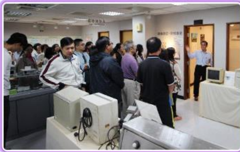
精進班學員參觀本局電子檔案保存實驗室