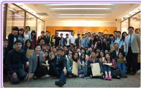
東華大學朱副校長景鵬(第1排左3)及高主任長(第2排右2)帶領學生參訪本局。

為拓展私人或團體珍貴文書徵集範圍，本局104年廣續與中華民國農民團體幹部聯合訓練協會(簡稱農訓協會)合作，進行農漁會文書徵集作業，計有基隆區漁會、臺南市柳營區農會及南縣區漁會等3家農漁會捐贈文書，並於105.05.05假農訓協會年度會員代表大會，由本局陳副局長海雄公開致送捐贈證明書及感謝狀。