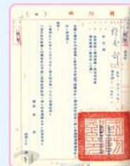
圖11 國防部決定贈送日本丹陽艦部分零件 檔號：0055/23.1/89001 案名：日人請撥贈丹陽艦 來源機關：外交部 管有機關：國家發展委員會檔案管理局

60年6月30日，我國駐日本大使館於東京隆重舉行贈送丹陽艦零件目錄典禮及酒會，曾擔任日本首相之岸信介先生率「雪風返還讓渡促進議員聯盟」等40人出席，除了感謝歸還丹陽艦重要零件外，亦針對運送細節交換意見(圖12、圖13)。10月，這些機件包裝後，從高雄港運往神戶港，再由駐日本大使館轉轉交付日本政府，安置於江田島紀念館(圖14)。目前，我國贈送日本的艦錨與舵輪，仍保存於江田島海上自衛隊學校；而艦艇的車葉及艦鐘則於高雄左營之海軍官校展示，供各界參觀(註1)。