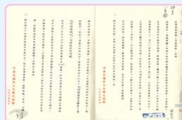
圖8 國防部婉拒日本贈與請求 檔號：0055/23.1/89001 案名：日人請撥贈丹陽艦 來源機關：外交部 管有機關：國家發展委員會檔案管理局

後來，老舊的丹陽艦在訓練過程中受創嚴重，難再修復又有沉沒之虞，甚難曳航日本，國防部遂依照國軍廢舊軍品辦法予以解體(圖9)。儘管如此，日本仍冀望保存丹陽艦遺留的羅盤、舵轉作為紀念(圖10)。