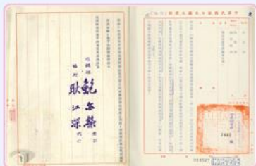
圖9 國防部以丹陽艦艦體惡劣請唐榮公司解體 檔號：0059/541/1 案名：廢鐵 來源機關：唐榮鐵工廠股份有限公司 管有機關：國家發展委員會檔案管理局

59年12月，政府為彰顯對日友好關係，決定將某些機件撥贈日本留念，考量錨與舵輪為船體主要部分，最能象徵船艦意義，爰將丹陽艦遺留的山字錨一具與舵房舵輪一個，轉贈日本(圖11)。