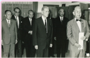
圖12 岸信介率員參加贈送丹陽艦零件目錄典禮 檔號：0055/23.1/89001 案名：日人請撥贈丹陽艦 來源機關：外交部 管有機關：國家發展委員會檔案管理局