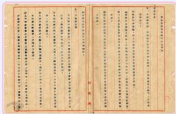
圖3 管制資匪航運臨時辦法草案 檔號：0035/343.72/4 案名：截捕違背關閉法令之船舶 來源機關：外交部 管有機關：國家發展委員會檔案管理局