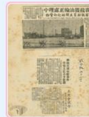
圖5 陶普斯號油輪事件引起國際爭論 檔號：0043/199/2 案名：陶普斯號油輪案 來源機關：外交部 管有機關：國家發展委員會檔案管理局

在此之後，丹陽艦多次參與臺海戰役，直至55年因機件裝備老舊，缺乏維修零件而奉命除役。日本佐世保市因對丹陽艦情有獨鍾，獲悉消息後立即透過外交管道，希望國防部撥贈或轉售丹陽艦，供日方永久紀念，並告誡後人勿輕啟戰爭及維護和平的真諦(圖6)。雖然此事能夠促進我國與日本雙方友好關係，但國防部以該艦仍作海軍訓練之用，故而婉拒日本的請求(圖7、圖8)。