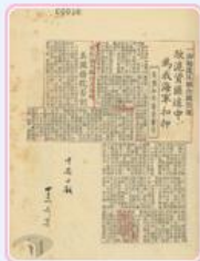
圖4 海軍扣押陶普斯號油輪報導 檔號：0043/199/2 案名：陶普斯號油輪案 來源機關：外交部 管有機關：國家發展委員會檔案管理局