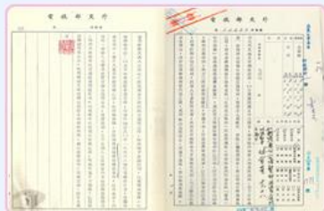
圖10 日本盼望獲得羅盤舵轉等零件 檔號：0055/23.1/89001 案名：日人請撥贈丹陽艦 來源機關：外交部 管有機關：國家發展委員會檔案管理局