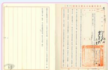
圖6 日本佐世保市請求撥贈丹陽艦 檔號：0055/23.1/89001 案名：日人請撥贈丹陽艦 來源機關：外交部 管有機關：國家發展委員會檔案管理局

在此之後，丹陽艦多次參與臺海戰役，直至55年因機件裝備老舊，缺乏維修零件而奉命除役。日本佐世保市因對丹陽艦情有獨鍾，獲悉消息後立即透過外交管道，希望國防部撥贈或轉售丹陽艦，供日方永久紀念，並告誡後人勿輕啟戰爭及維護和平的真諦(圖6)。雖然此事能夠促進我國與日本雙方友好關係，但國防部以該艦仍作海軍訓練之用，故而婉拒日本的請求(圖7、圖8)。