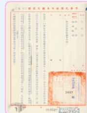
圖14 丹陽艦山字錨與舵輪運送事宜 檔號：0055/23.1/89001 案名：日人請撥贈丹陽艦 來源機關：外交部 管有機關：國家發展委員會檔案管理局

丹陽艦經歷第二次世界大戰與臺海戰役，為我國重要記憶之一環。若想要了解更多有關丹陽艦的訊息，歡迎前往 國家檔案資訊網 查詢。