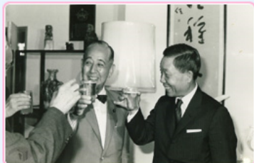
圖13 駐日大使彭孟緝在酒會上接待岸信介等人 檔號：0055/23.1/89001 案名：日人請撥贈丹陽艦