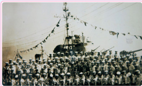
丹陽艦官兵於除役典禮當日合影