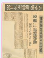
圖7 日本長崎新聞報導爭取丹陽艦的消息 檔號：0055/23.1/89001 案名：日人請撥贈丹陽艦 來源機關：外交部 管有機關：國家發展委員會檔案管理局